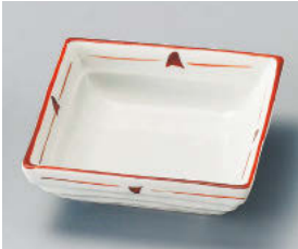
□101-018 赤絵千鳥角鉢 11.4×4cm (磁) JPN 1,430円