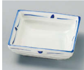
□101-048 染付千鳥松花堂 11.4×4cm (磁) JPN 1,320円