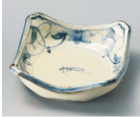
ホ101-078 新唐草角松華堂鉢 11×11×3.8cm (磁) JPN 1,200円