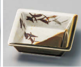
ミ101-108 織部芦角鉢 11.5×11.5×3.5cm (磁) JPN 1,250円