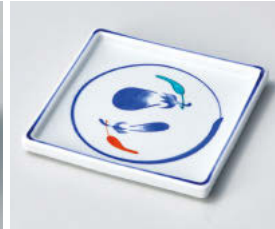
ツ101-058 茄子正角皿 11.3×11.3×1.1cm (磁) JPN 1,160円