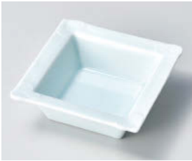
イ101-118 青白磁渦正角鉢 11×11×3.7cm JPN 1,100円