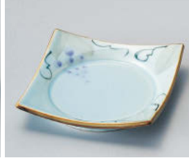
ミ101-098 手書きびどう四方皿 11.4×11.4×2.3cm (磁) JPN 1,260円