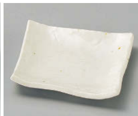
ア101-298 粉引(松花堂兼用)角小皿 10.8×10.8×2.2cm (磁) JPN 600円