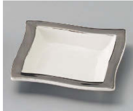
ア101-138 プラチナリムトレーS 11×11×2cm (磁) JPN 1,250円