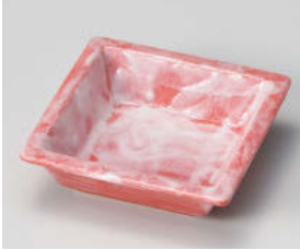
カ101-068 赤染正角鉢 11.3×11.3×3.4cm (磁) JPN 1,150円