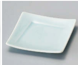
イ101-198 青白磁4.0角皿 11×11×2.2cm (磁) JPN 1,050円