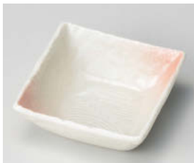
ト101-278 桜吹クシ目 松花堂角鉢 10.5×10.5×4cm (磁) JPN 620円