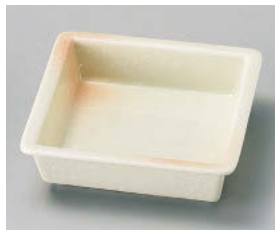
ホ101-288 ピンク吹松花堂角鉢 11.5×11.5×3.5cm (磁) JPN 650円