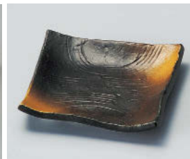
ア101-308 備前吹(松花堂兼用)角小皿 10.8×10.8×2.2cm (磁) JPN 600円