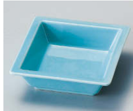
チ101-038 トルコ角鉢 11.4×3.6cm (磁) JPN 1,300円