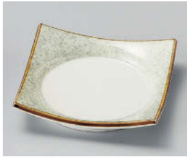
ミ101-128 瀏サビグリーン吹正角皿 11.4×11.4×2.5cm (磁) JPN 1,250円