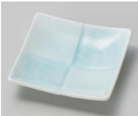
ネ101-168 正角市松皿 青白磁 11×11×2cm (磁) JPN 1,050円