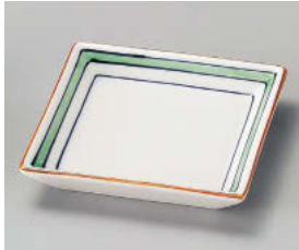
ツ101-028 瀏グリーン角皿 11×2.3cm (磁) JPN 1,300円