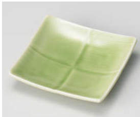
ト101-178 ヒスイ 市松正角皿 10×10×2.3cm (磁) JPN 960円