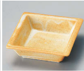
チ101-148 志野角鉢 11.4×3.6cm (磁) JPN 1,080円