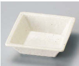
ホ101-268 粉引松花堂角鉢 11×11×3.5cm (磁) JPN 680円