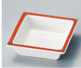
ミ101-088 瀏赤角鉢 11.5×11.5×3.6cm (磁) JPN 1,350円