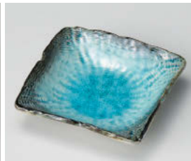
ト101-248 スカイ 縄目正角皿(小) 11×11×3cm (磁) JPN 780円