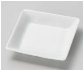
ア101-228 白11.5cm正角皿 11.4×11.4×2.5cm (磁) JPN 1,050円