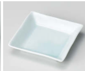
ホ101-258 青白磁正角深皿(松花堂) 11.3×11.3×2.4cm (磁) JPN 1,050円