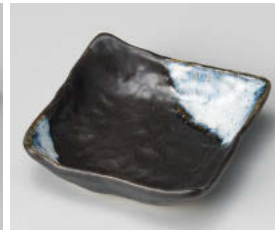
□101-208 融雪 4寸角小鉢 10.8×10.8×3.2cm (陶) JPN 910円