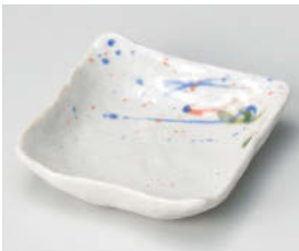
□101-218 はるかぜ 4寸角小鉢 10.9×10.9×3cm (陶) JPN 910円