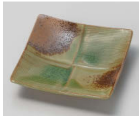
ト101-188 オリベ 市松正角皿 10×10×2.3cm (磁) JPN 960円