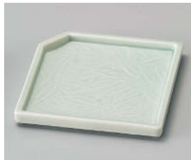
ト101-238 青磁笹角皿 11.6×11×1.2cm (磁) JPN 720円