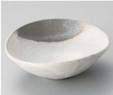
×043-048 灰釉粉引|5.6楕円鉢 17×15.5×6cm JPN