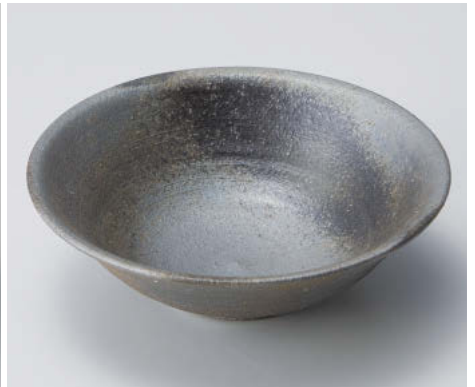
×043-058 黒銀彩5.6丸鉢 φ17×6cm JPN