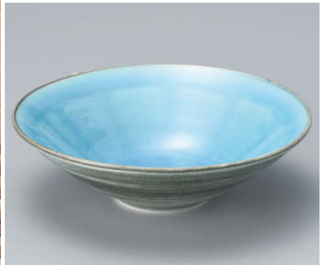
×043-028 トルコブルー-7.0鉢 φ21×6.5cm JPN