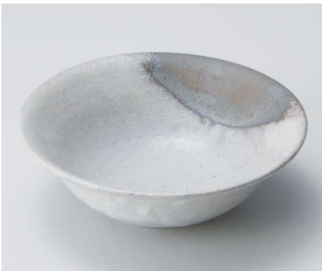
×043-068 灰釉粉引|5.6丸鉢 φ17×6cm JPN