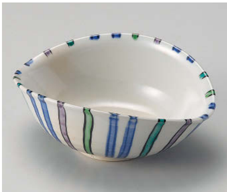
カ043-078 色十草楕円向付 14.5×11×5.7cm (磁) JPN