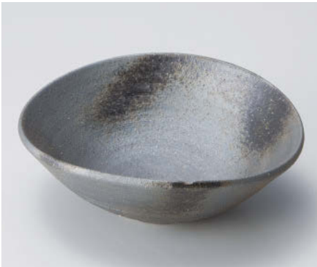
×043-038 黒銀彩5.6楕円鉢 17×15.6×6cm JPN