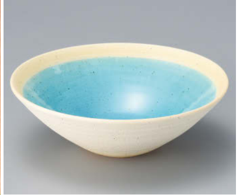
×043-018 焼メブルー-6.6丸鉢 φ20×6.5cm JPN