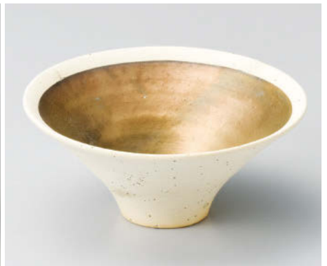
×043-088 焼メ金彩6.2そり鉢 φ18.8×7cm (陶) JPN ×043-098 焼メ金彩5.1そり鉢 φ14.5×6.2cm (陶) JPN