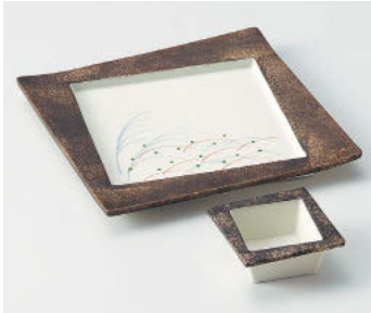
≒018-058 秋草金タタキ正角前菜皿 18×18×1.7cm(磁)JPN 3,140円 ≒018-068 秋草金タタキ正角干代口 6.7×6.7×2.8cm(磁)JPN 1,080円