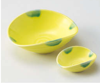
ト018-298 黄釉グリーン流し向付 15.8×13.5×5.5cm(磁)JPN 2,650円 ト018-308 黄釉グリーン流し干代口 8.8×6.8×3cm(磁)JPN 1,200円