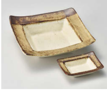
ト018-338 角刈サビ刺身鉢 16.7×16.7×4.6cm(磁)JPN 2,800円 ト018-348 角刈サビ長角干代口 8.8×6.5×2.5cm(磁)JPN 1,100円