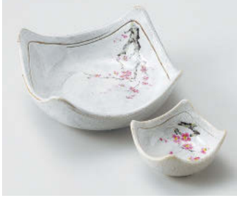
オ018-218 罍書紅梅5.5四方鉢 15.5×15.5×7.7cm(磁)JPN 2,950円 オ018-228 罍書紅梅3.3四方鉢 8.5×8.5×4.5cm(磁)JPN 1,350円