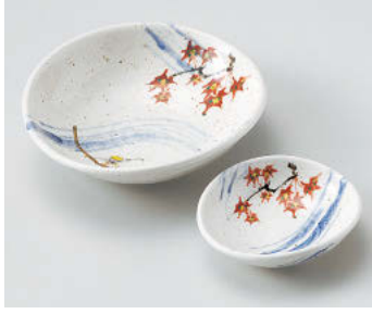
オ018-178 粉引あらしやま楕円向付鉢 15.8×14.5×4.3cm(磁)JPN 3,100円 オ018-188 粉引あらしやま干代口 10.2×9.2×3cm(磁)JPN 1,970円