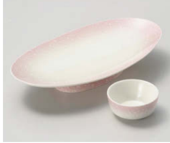
≒018-118 ピンク白吹 高台 楕円皿 23.7×12.8×4.3cm(磁)JPN 3,100円 ≒018-128 ピンク白吹 丸干代口 φ6.7×3cm(磁)JPN 980円