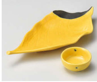
□018-398 黄輝葉型刺身鉢 28.5×12.2×3.3cm(強)JPN 2,850円 □018-408 黄輝丸干代口 φ7×3cm(強)JPN 870円