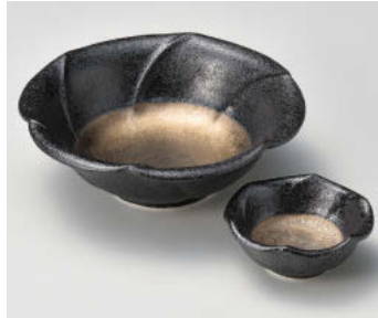
ツ018-078 本窯金彩輪花向付 φ16×5.5cm(強)JPN 2,800円 ツ018-088 本窯金彩輪花干代口 φ7.8×3.3cm(強)JPN 1,400円