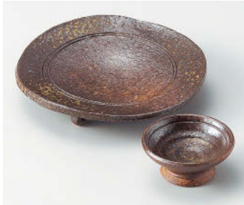
≒018-018 備前風丸高台向付 φ15.5×3cm(陶)JPN 3,230円 ≒018-028 備前風干代口 φ7.5×3cm(陶)JPN 1,740円