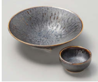
イ018-158 白土孔雀トチリ 刺身鉢 φ17.5×4.8cm(陶)JPN 3,100円 イ018-168 白土孔雀トチリ 丸干代口 φ7×3.4cm(磁)JPN 1,380円