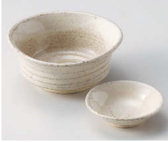
ト018-378 白萩深鉢 φ14.7×6.2cm(陶)JPN 2,650円 ト018-388 白萩干代口 φ9.7×2.8cm(陶)JPN 1,000円