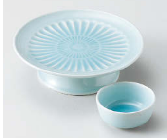
ツ018-278 青白磁高台刺身鉢 φ15.7×4.7cm(磁)JPN 2,700円 ツ018-288 青白磁丸干代口 φ6.6×3cm(磁)JPN 880円