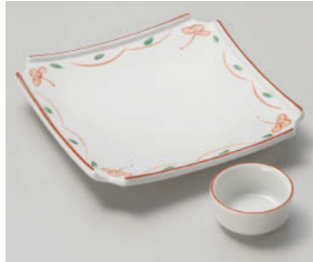
≒018-038 花つなぎ 正角前菜皿 18.5×18.5×3.2cm(磁)JPN 3,250円 ≒018-048 朱巻 丸干代口 φ6.2×3cm(磁)JPN 820円