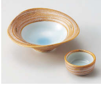
ネ018-258 信楽金銀彩なぶり向付 φ15×5cm(磁)JPN 2,750円 ネ018-268 信楽金銀彩干代口 φ6.5×3cm(磁)JPN 1,200円