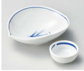
□018-318 魚画楕円向付 16.3×13.6×5.3cm(強)JPN 2,910円 □018-328 呉須一筆丸干代口 φ6.8×3cm(強)JPN 870円