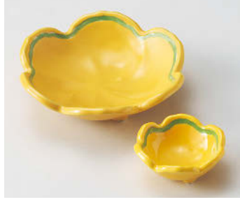
オ018-198 黄釉グリーン梅型向付 φ15.5×4.7cm(磁)JPN 3,200円 オ018-208 黄釉グリーン梅型干代口 8.1×3.3cm(磁)JPN 1,250円