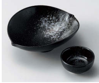
ア018-358 白吹瀬戸黒向付 16.3×13.3×5.3cm(磁)JPN 2,850円 ア018-368 白吹瀬戸黒丸干代口 φ6.7×3cm(磁)JPN 900円