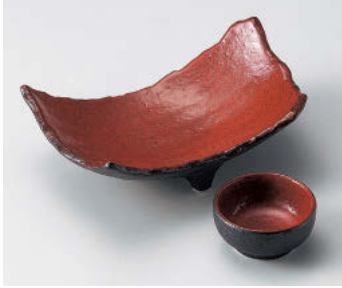
ツ018-138 紅黒炭三ッ足両切向付 19×13×6.7cm(陶)JPN 2,800円 ツ018-148 紅黒炭丸干代口 φ7×3.5cm(陶)JPN 1,200円