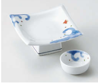
≒018-098 染錦波千鳥45高台皿 13.5×13.5×6.5cm(磁)JPN 3,200円 ≒018-108 染錦波千鳥丸干代口 φ6.7×3cm(磁)JPN 1,100円