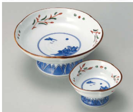
カ012-058 赤絵京山水刺身 φ15×7cm(強)JPN 5,000円 カ012-068 赤絵京山水千代口 φ8.5×5cm(強)JPN 1,900円