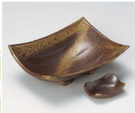
≡012-018 手造り備前風角尺一盛鉢 28.8×21.4×8.6cm(陶)JPN 10,000円 ≡012-028 備前風長角千代口 9.8×7.8×2.9cm(陶)JPN 1,300円