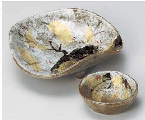
ト012-038 唐津環瑠木5.5皿 16.5×15.5×5.2cm(陶)JPN 5,000円 ト012-048 唐津環瑠木千代口 φ8×2.7cm(陶)JPN 1,750円