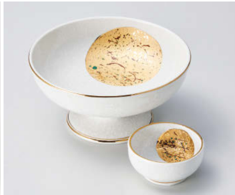
ツ012-158 萬月金月花丸高台刺身鉢 φ15.5×7.8cm(磁)JPN 4,300円 ツ012-168 萬月金月花丸千代口 7.1×3.5cm(磁)JPN 1,150円