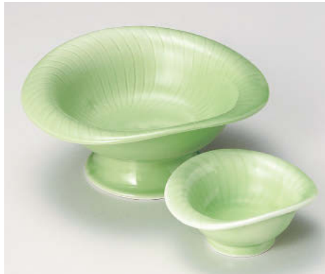
ア012-138 ヒワ高台刺身鉢 18.3×16.3×8cm(強)JPN 4,700円 ア012-148 ヒワ高台千代口 10.9×9.2×4.9cm(強)JPN 1,250円