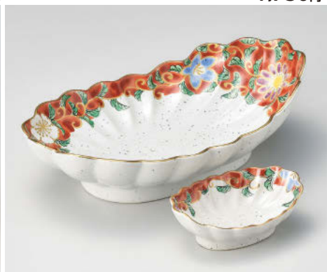
ウ012-098 錦草花花菊型向付 φ25×15.5×7cm(強)JPN 4,700円 ウ012-108 錦草花菊型千代口 φ11×7×3.4cm(強)JPN 1,940円