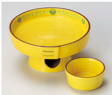
≡012-078 三方型高台刺身鉢 φ14.3×7cm(磁)JPN 6,300円 ≡012-088 三方型丸千代口 φ7×3.4cm(磁)JPN 2,300円