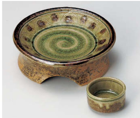
ツ012-118 美濃伊賀アラビア文様高台5.5刺身 17.3×5.8cm(陶)JPN 4,650円 ツ012-128 美濃伊賀丸千代口 φ6.2×3.4cm(陶)JPN 970円