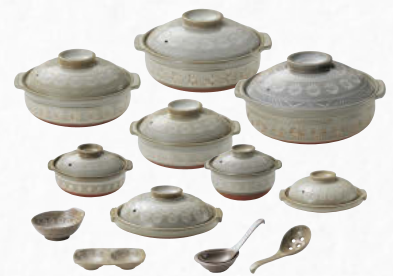
土鍋オープン ..... P.398-399 Donabe Hot Pot