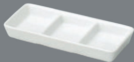
10-208-18-57390001 ¥1,580 スタック三品皿 17×7.3×2.6