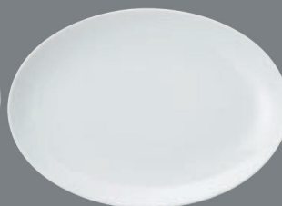
10-208-16-57350001 ¥1,700 メタ玉23cmプラター 22.8×16.2×2.3