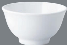
10-208-6-48648001 ¥970 反15cm深井 14.5×8.2・680cc