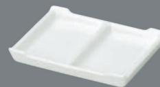
10-208-20-57370001 ¥750 二連薬味皿 10.5×7.8×1.5