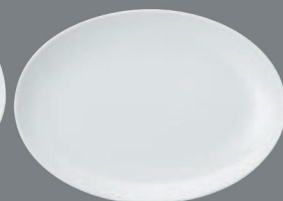
10-208-17-57360001 ¥1,500 メタ玉20cmプラター 20.4×14.4×2.2