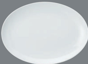
10-208-15-57340001 ¥2,470 メタ玉25cmプラター 25.3×18.2×2.6