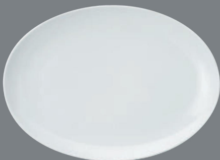
10-208-14-57330001 ¥3,750 メタ玉31cmプラター 30.5×22×3.2