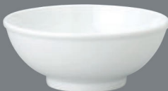
10-208-2-57290001 ¥1,050 15cm玉井 15.2×6.4・600cc