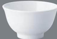
10-208-7-48642001 ¥880 反13cm深井 13.2×7.6・510cc