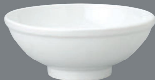
10-208-1-57280001 ¥1,380 19cm玉井 18.7×8・1,000cc