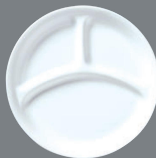
10-131-2-50522001 ¥2,250 21cm丸仕切皿 21.5×2.6