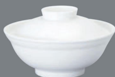
¥1,650 10-131-11-49040001 ¥890 多用碗 (大) 14.8×6.1・300cc 10-131-12-49070001 ¥760 蓋 (大) 13.1×3.6