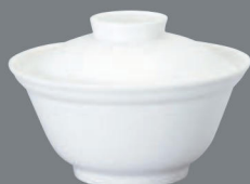
¥1,650 10-131-5-49010001 ¥890 ライス碗 (大) 14.8×7.1・400cc 10-131-6-49070001 ¥760 蓋 (大) 13.1×3.6