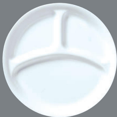
10-131-1-50521001 ¥3,500 26cm丸仕切皿 26×2.5