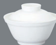
¥1,490 10-131-9-49030001 ¥770 ライス碗 (小) 12.2×5.9・200cc 10-131-10-49090001 ¥720 蓋 (小) 10.9×3.3