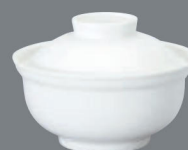
¥1,490 10-131-15-49060001 ¥770 多用碗 (小) 12.2×5.9・250cc 10-131-16-49090001 ¥720 蓋 (小) 10.9×3.3