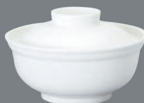
¥1,600 10-131-13-49050001 ¥870 多用碗 (中) 13.6×6.1・300cc 10-131-14-49080001 ¥730 蓋 (中) 12.2×3.3