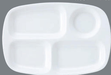
10-131-3-50516001 ¥5,600 29cm仕切皿 29×19.6×2.4