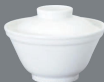
¥1,600 10-131-7-49020001 ¥870 ライス碗 (中) 13.4×7・300cc 10-131-8-49080001 ¥730 蓋 (中) 12.2×3.3