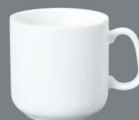
10-130-23-51130001 ¥920 マグカップ 7.3×7.3・200cc