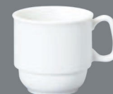
10-130-24-51139001 ¥870 スタックカップ 7.3×7.2・200cc