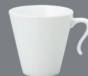
10-130-30-50102001 ¥1,050 オープンハンドルカップ M 8.6×8.5・250cc