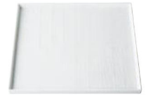
角皿 市松彫・大 73424[8] | ¥6,000(1) 28×28×2cm | 820g