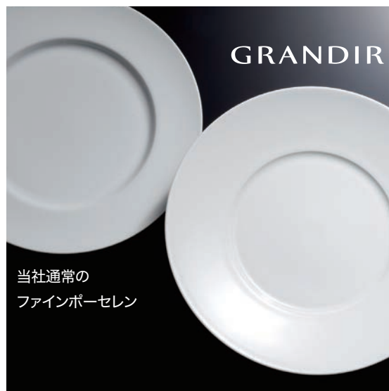
当社通常の ファインポーセレン