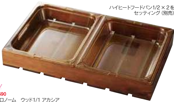
ハイヒートフードパン1/2 × 2を セッティング (別売)