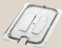
ハンドルノッチドリッド