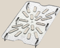
ドレンセルフ(水切)