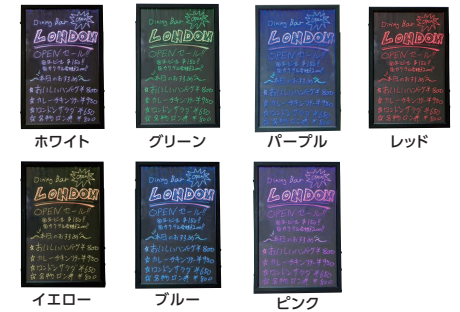
ホワイト グリーン パープル レッド イエロー ブルー ピンク