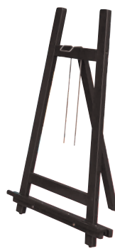
⑪ ローイーゼル90 [VESL-31] 組

13-1126-1001 ¥8,700 サイズ:475×700×H1,200 重量:1.8kg ●5段階の高さ調整が可能です。