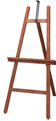
③ 木製イーゼル HEBC-12 茶