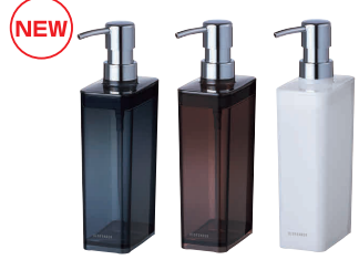
㉑ ディスペンサー スリム [TSPD-02] 目 ブルー 13-1110-2201 ¥1,300 ブラウン 13-1110-2202 ¥1,300 ホワイト 13-1110-2203 ¥1,300 サイズ: 58×950×H225 材質: 本体・フタ/PET、パッキン/シリコンゴム 付属品: 用途シール ●フタがはずせて洗いやすく、詰め替えやすいです。 ●底面湾曲形状で中身を使い切りやすいです。