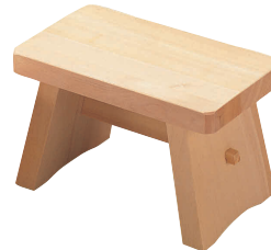
⑫ 桧風呂椅子(大) [THIS-01] 目 13-1110-1201 ¥6,400 サイズ: 300×180×H190