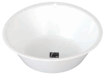
① フロート 洗面器 (フック穴付) [TFRS-12] 目 13-1110-0101 ¥700 サイズ: φ300×H90 容量: 3.8ℓ