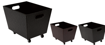
⑦ バッグレスト(キャスター付)TM-P [QBR5-05] △ 目 ブラック 13-1110-0701 ¥12,800 ブラウン 13-1110-0702 ¥12,800 クロコダイル 13-1110-0703 ¥12,800 サイズ: 425(355)×325(255)×H275 取手: 105×H38 材質: 合皮