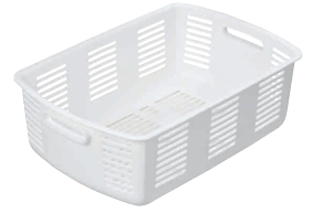
⑤ フロート 脱衣かご [TFRS-09] 目 13-1110-0501 ¥1,600 サイズ: 525×350×H185 材質: ポリプロピレン ●すっきりと手入れのしやすい形。