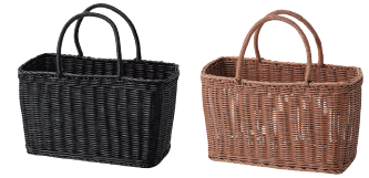
⑨ 湯かご 角 91-17 [THIK-07] ブラック 13-1110-0901 ¥4,200 ブラウン 13-1110-0902 ¥4,200 サイズ: 340×190×200 総高: 320 材質: PP