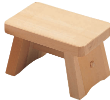
⑪ 桧風呂椅子(中) [THIS-02] 目 13-1110-1101 ¥4,900 サイズ: 260×165×H158