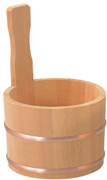
⑭ 榎片手湯桶 [TYOK-03] 目 13-1110-1401 ¥5,200 サイズ: φ143×H238