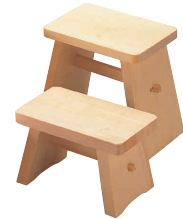
⑬ ヒバ・特選風呂椅子 [THIS-04] 目 サイズ 大 300×200×H300 13-1110-1301 ¥9,200 小 300×180×H250 13-1110-1302 ¥7,800