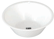
② フロート 湯桶 N25 (フック穴付) [TFRS-13] 目 13-1110-0201 ¥630 サイズ: φ270×H95 容量: 2.9ℓ