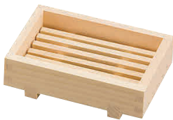
⑩ 桧石けん箱 [TSKD-02] 目 13-1110-1001 ¥900 サイズ: 126×85×H38