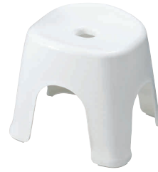
④ フロート おふる椅子 N30 [TFRS-10] 目 13-1110-0401 ¥2,400 サイズ: 360×300×H300 材質: 本体/ポリプロピレン 脚部/ポリエチレン ●立つ、座るがラクな高さです。