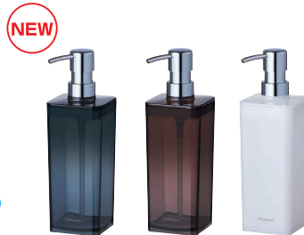
⑳ ディスペンサー N550 [TSPD-01] 目 ブルー 13-1110-2101 ¥1,300 ブラウン 13-1110-2102 ¥1,300 ホワイト 13-1110-2103 ¥1,300 サイズ: 73×870×H225 材質: 本体・フタ/PET、パッキン/シリコンゴム 付属品: 用途シール ●フタがはずせて洗いやすく、詰め替えやすいです。 ●底面湾曲形状で中身を使い切りやすいです。