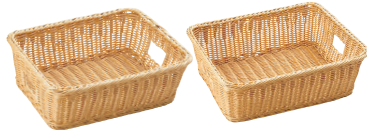
⑥ 樹脂製脱衣かご手付アイボリー [THIK-03] サイズ 大 500×400×H150 13-1110-0601 ¥8,400 中 450×350×H150 13-1110-0602 ¥6,900 小 400×300×H130 13-1110-0603 ¥5,300 材質: ポリプロピレン・ステンレス ●水気で傷む心配がないため、幅広く活用できます。