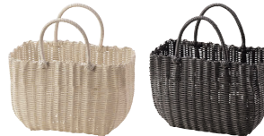
⑧ 湯かご 91-10 [THIK-05] ベージュ 13-1110-0801 ¥2,500 ブラウン 13-1110-0802 ¥2,500 サイズ: 375×165×H235 総高: 370 材質: PP