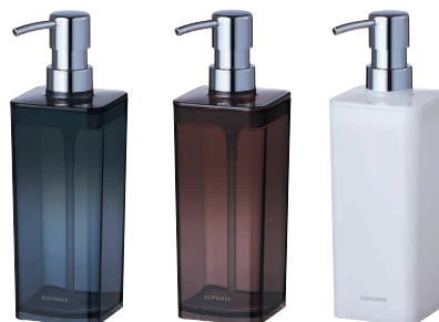
㉒ ディスペンサー N800 [TSPD-03] △ 目 ブルー 13-1110-2301 ¥1,700 ブラウン 13-1110-2302 ¥1,700 ホワイト 13-1110-2303 ¥1,700 サイズ: 79×850×H257 材質: 本体・フタ/PET、パッキン/シリコンゴム 付属品: 用途シール ●フタがはずせて洗いやすく、詰め替えやすいです。 ●底面湾曲形状で中身を使い切りやすいです。