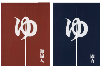
⑳ ゆのれん NED0525 [VNRB-15] 目 EE(えんじ) 13-1110-2001 ¥9,700 BB(紺) 13-1110-2002 ¥9,700 サイズ: 900×1,200 生地素材: 綿(ブッチャー)100%