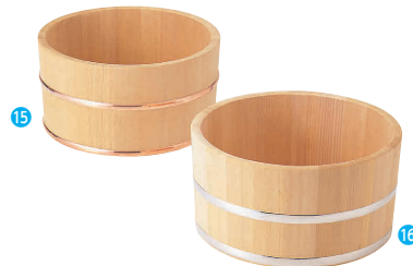
⑮ 榎湯桶 銅タガ [TYOK-01] 目 13-1110-1501 ¥4,800 サイズ: φ225×H115