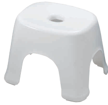
③ フロート おふる椅子 新 N25 [TFRS-11] 目 13-1110-0301 ¥2,050 サイズ: 340×270×H250 材質: 本体/ポリプロピレン 脚部/ポリエチレン ●しっかりと安定感があります。