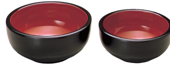
⑫⑨(若)多用ボール 黒刷毛目内朱 [RTYB-01] W