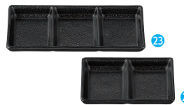
㉓三品皿 黒 [RMSR-26] E