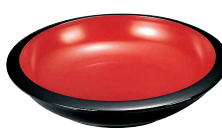
⑫⑤(福)宝来鉢 黒内朱 [RTPT-02] W