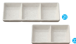
㉑三品皿 粉引 [RMSR-25] E