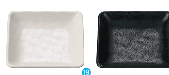
⑲正角皿 粉引 [RMSR-23] E