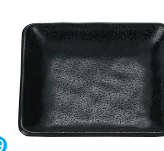
⑳正角皿 黒 [RMSR-24] E