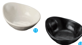
⑪天つゆ入れ 粉引 [RTYI-08] E

13-1081-1101 ¥660 サイズ:128×105×H44 容量:170ml