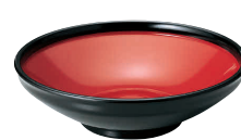
⑫⑦(福)ふる里鉢 黒内朱 [RTPT-03] W