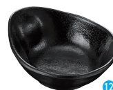
⑫天つゆ入れ 黒 [RTYI-09] E

13-1081-1101 ¥660 サイズ:128×105×H44 容量:170ml