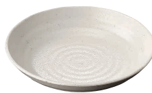
⑤23cm丸深皿 粉引 [RMSR-03] E

13-1081-0501 ¥1,670 サイズ:φ228×H46 容量:1,000ml