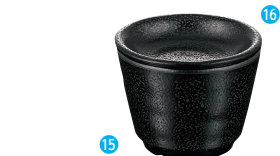
⑮そばちょこ 黒 [RTYI-11] E