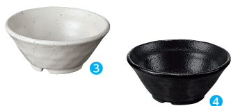
③丸小鉢 小 粉引 [RMSR-19] E