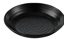
⑧23cm丸深皿 黒 [RMSR-04] E

13-1081-0501 ¥1,670 サイズ:φ228×H46 容量:1,000ml