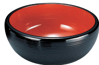
⑫⑥(福)千筋ナツメ鉢 黒内朱 [RTYB-02] W