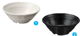
①丸小鉢 粉引 [RMSR-17] E