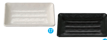
⑰長角皿 小 粉引 [RMSR-21] E