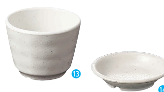
⑬そばちょこ 粉引 [RTYI-10] E

13-1081-1201 ¥660 サイズ:128×105×H44 容量:170ml