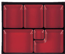
⑦ (若)尺1寸長手へぎ目松花堂用 6ツ仕切 朱天黒 [RSKD-07] W 13-1074-0701 ¥1,150 サイズ:291×238×H35 材質:ABS樹脂