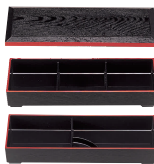
⑩ (若)大寿弁当 黒淵朱 [RDIJ-01] W サイズ 蓋 375×135×H20 13-1074-1001 ¥ 850 3ツ仕切 362×124×H57 13-1074-1002 ¥1,150 タレ付 362×124×H57 13-1074-1003 ¥1,150 材質:ABS樹脂