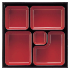
② (若)8.5寸松花堂用 DX 仕切 朱天黒 [RSKD-02] W 13-1074-0201 ¥1,000 サイズ:235×235×H40 材質:ABS樹脂