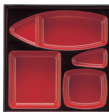
③ (若)8.5寸松花堂用 舟型仕切 朱天黒 [RSKD-03] W 13-1074-0301 ¥1,350 サイズ:235×235×H40 材質:ABS樹脂