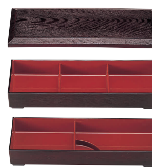
⑪ (若)大寿弁当 溜内朱 [RDIJ-02] W サイズ 蓋 375×135×H20 13-1074-1101 ¥ 950 3ツ仕切 362×124×H57 13-1074-1102 ¥1,350 タレ付 362×124×H57 13-1074-1103 ¥1,350 材質:ABS樹脂

ABS樹脂…耐久性に優れ、衝撃に強く割れにくい。塗料の密着も良好ではげにくい。食器洗浄機は不可。(耐熱温度:60℃~70℃)