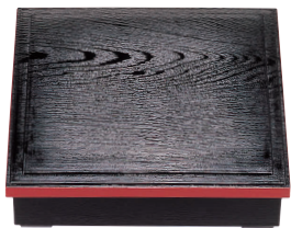
① (若)8.5寸木目松花堂 黒淵朱 内塗無 (仕切別) [RSKD-01] W 13-1074-0101 ¥1,230 サイズ:260×260×H60 材質:ABS樹脂