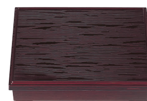
⑥ (若)尺1寸長手へぎ目松花堂 溜 (仕切別) [RSKD-06] W 13-1074-0601 ¥2,850 サイズ:313×260×H68 材質:ABS樹脂