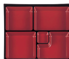
⑨ (若)尺1寸長手布目松花堂用 5ツ仕切 朱天黒 [RSKD-09] W 13-1074-0901 ¥1,250 サイズ:291×236×H37 材質:ABS樹脂