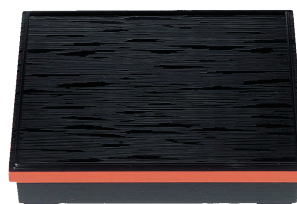
⑤ (若)尺1寸長手へぎ目松花堂 黒淵朱 (仕切別) [RSKD-05] W 13-1074-0501 ¥2,450 サイズ:313×260×H68 材質:ABS樹脂