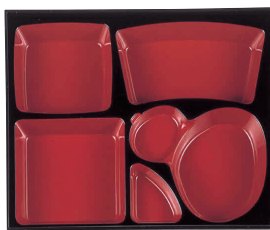
⑧ (若)尺1寸長手御膳松花堂用 ひさご仕切 朱天黒 [RSKD-08] W 13-1074-0801 ¥1,350 サイズ:291×236×H39 材質:ABS樹脂