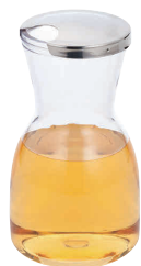
① UK ワイン&ジュースデカンター メタルトップ [PDCT-18]