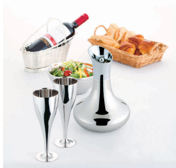
⑥ UK 18-8 デカンター [PDCT-16]