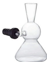
⑪ デカンタ Wine lab H-8569