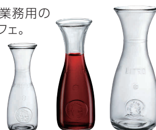
⑩ ミズラ カラフェ [PDCT-02]