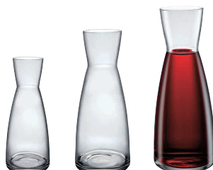
⑨ イプシロン デカンター [PDCT-01]