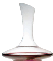
⑫ レーマン ヴィノブル・デカンタ 1,500cc [GDCT-16] △ G