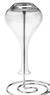
⑦ デカンタスタンド レボリューション 240028 [PDCT-10] J