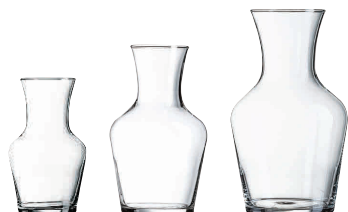
⑧ ヴァン カラフェ [PDCT-03]