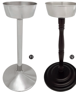
⑪ SW18-8 シャンパンクーラー スタンド