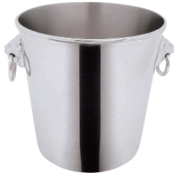
① SW18-8 B 測 シャンパンクーラー