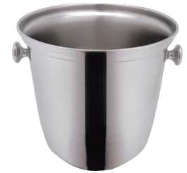
④ SW18-8 B型 シャンパンクーラー