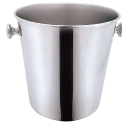
③ SW18-8 A型 シャンパンクーラー