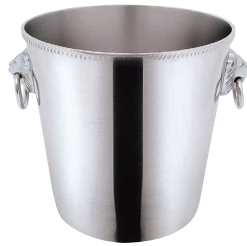
② SW18-8 菊 測 シャンパンクーラー