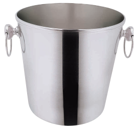
⑤ SW18-8 B 測 玉付 シャンパンクーラー