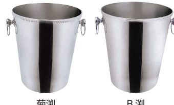
⑦ SW18-8 ロング シャンパンクーラー