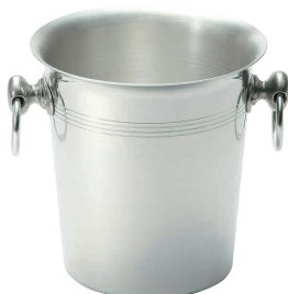
⑬ イタリア製 アルミ ワイングラス