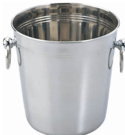
⑭ イタリア製 ステンレス ワイングラス