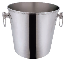
⑥ SW18-8 菊 測 玉付 シャンパンクーラー