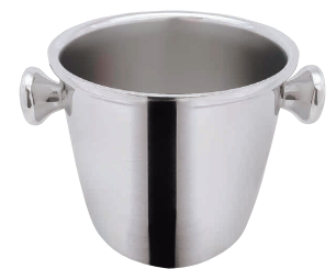
⑧ SW18-8 二重 シャンパンクーラー