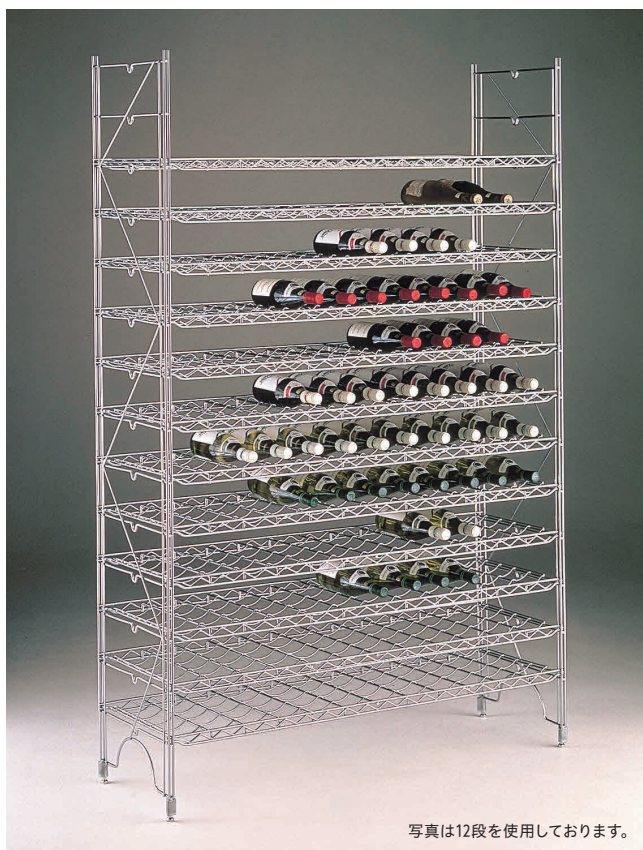
写真は12段を使用しております。

デリケートなワインだからこそ、もっと丁寧に扱いたい…。 ただ単に収納・保管するだけでなく、店舗の雰囲気づくりなど、 ディスプレイにも最適です。