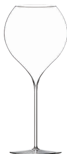
⑥ フィリップジャメス・シグネチャーモデル シナジー60(6ヶ入) [SWG02] G

13-0987-0501 ¥60,000 サイズ: φ115×H250 750cc