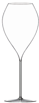
⑨ フィリップジャメス・シグネチャーモデル グランシャンパーニュ45(6ヶ入)

[SWG05] G 13-0987-0901 ¥57,000 サイズ: φ88×H234 450cc