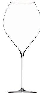
⑦ フィリップジャメス・シグネチャーモデル グランルージュ70(6ヶ入) [SWG03] G

13-0987-0601 ¥59,400 サイズ: φ104×H240 600cc