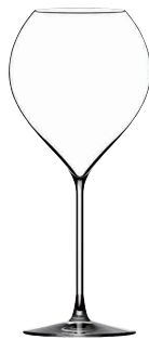
⑩ フィリップジャメス・シグネチャーモデル シナジー52(6ヶ入)

[SWG05] G 13-0987-0901 ¥57,000 サイズ: φ88×H234 450cc