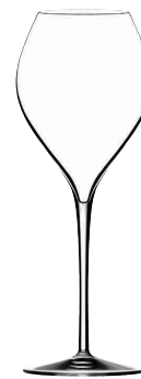
⑫ フィリップジャメス・シグネチャーモデル グランシャンパーニュ41(6ヶ入)

[SWG07] G 13-0987-1101 ¥18,000 サイズ: φ108×H213 540cc