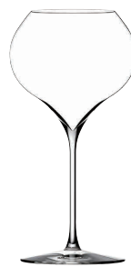
⑪ フィリップジャメス・シグネチャーモデル グランブラン54(6ヶ入)

[SWG06] G 13-0987-1001 ¥18,000 サイズ: φ100×H227 520cc