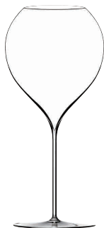
⑤ フィリップジャメス・シグネチャーモデル シナジー75(6ヶ入) [SWG01] G

13-0987-0501 ¥60,000 サイズ: φ115×H250 750cc