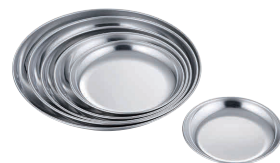
⑩ 18-0 市場用丸皿

ステンレス製の容器は、衛生面に優れ、軽くて丈夫、割れたりしないので半永久的に使い続けることができます。