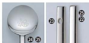
⑰ 18-8 ジール 朝鮮スプーン [OBBS-07] ◆