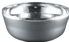
⑫ 18-10 スープ椀 [RSRS-01] ◆