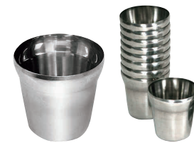
⑭ 18-10 ステンレスコップ [RSRC-01]