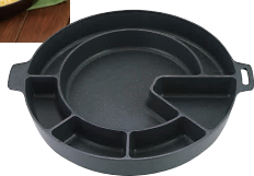
① アルミ ダッカルビ鍋 変形仕切