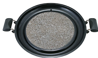
④ 韓国産 持手付丸焼肉鍋 (直火用) [RISN-04]