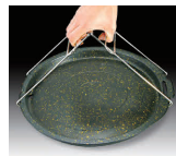
⑨ 韓国産 持手付石すき焼鍋 (直火用) [RISN-08]