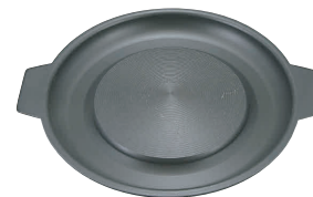
③ 韓国産 プルコギ鍋 (直火用) [RISN-02]