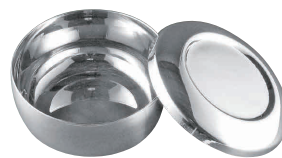
⑬ 18-10 ごはん容器 (フタ付)SR-02 [RSRG-01] ◆