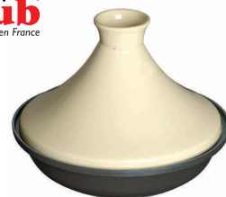
⑦ ストaub タジン鍋 ホワイト [RTJN-02] 洗 IH FR 外形 内径 高さ 深さ 重 kg 底面サイズ 20cm 205 180 150 30 0.6 1.2 140 13-0949-0701 ¥14,000 28cm 280 255 205 55 2.0 3.3 190 13-0949-0702 ¥27,000 材質:本体/鉄 蓋/セラミック