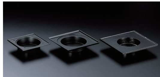
⑩ アルミ せいろ蒸し用水受け [RSIR-03] 外寸 内寸 M10-095 大 175×175×H30 165×165 13-0949-1001 ¥2,780 M10-094 中 155×155×H35 145×145 13-0949-1002 ¥2,180 M10-093 小 125×125×H30 115×115 13-0949-1003 ¥1,820