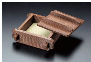
⑧ 樹脂製 せいろ蒸しセット ライトブラウン M44-141 [RSIR-14] 洗 13-0949-0801 ¥3,650 サイズ:183×183×H90 材質:ポリプロピレン ●耐久性に優れ、食器洗浄機の使用が可能です。