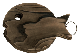
② 木製 魚敷板 [RNBS-02] 13-0949-0201 ¥720 サイズ:150×180