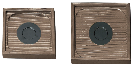
⑤ PP 敷板 縁付 [RNBS-06] 洗 サイズ M44-153 17角 170×170×H13 13-0949-0501 ¥715 M44-154 19.5角 195×195×H13 13-0949-0502 ¥830