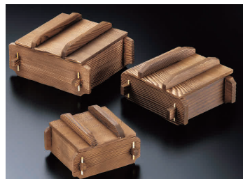
⑨ 木製 せいろ蒸しセット [RSIR-01] 外寸 内寸 M40-525 大 200×200×H90 140×140×H45 13-0949-0901 ¥4,600 M40-524 中 180×180×H90 120×120×H35 13-0949-0902 ¥3,870 M40-523 小 140×140×H80 100×100×H35 13-0949-0903 ¥3,500