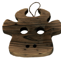
③ 木製 牛敷板 [RNBS-03] 13-0949-0301 ¥720 サイズ:160×140