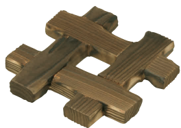
① 木製 井げた敷板 [RNBS-01] 13-0949-0101 ¥800 サイズ:150×150