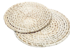
④ 藤製 銅敷丸 [RNBS-04] サイズ 大 φ180 13-0949-0401 ¥700 小 φ150 13-0949-0402 ¥560