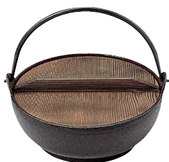
④ 鉄 電調用 みやま鍋

※21cmは電磁調理器非対応となります。 ※27・30・33cmは二本ツルです。