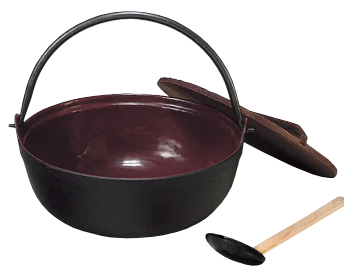
③ 五進 鉄 田舎鍋