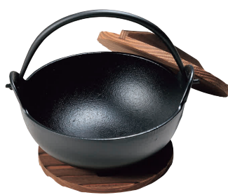
② トキワ 鉄 やまが鍋 413(黒めり)