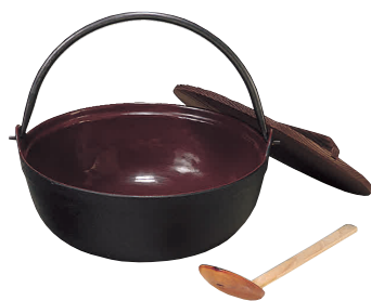
① トキワ 鉄 やまが鍋 401(茶ホーロー)