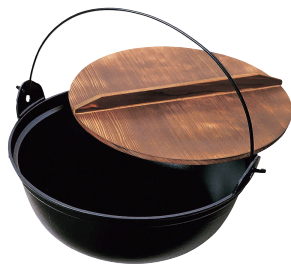
⑦ ジャンボ大鍋 [RTTN-17]