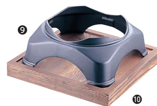
⑨ 特大 カマド 大鍋用 [RTTN-15]

13-0940-0901 ¥26,000 サイズ：370×370×H145 中心径：φ280 ●30cm～39cmの大鍋に対応しています。