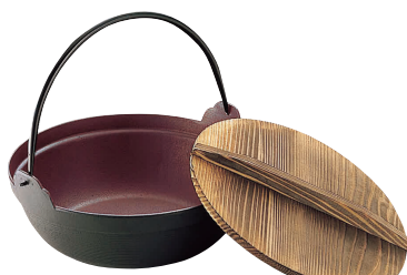
⑤ IK 鉄 深型鍋(内側茶ホーロー仕上)