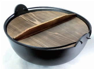
⑧ 五進 アルミ ジャンボ 田舎鍋