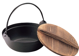
⑪ IK S鉄鍋 木蓋付 [RTTN-09] E