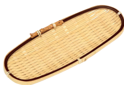
⑧ 竹製 ロケットおしぼり入れ [QOSB-22]

13-0871-0601 ¥2,500 サイズ:400×270 材質:綿100%