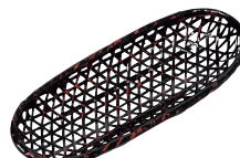
⑮ ランタイ小判オシボリ [QOSB-30]