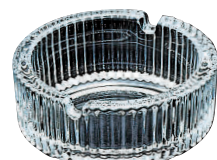
㉔ ガラス製 ポシェ灰皿 P-05554 [QHZR-31] E