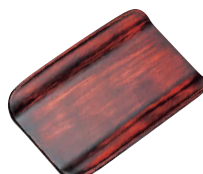
⑲ 二人用富士おしぼり受け [QOSB-34] W

13-0871-1801 ¥1,200 サイズ:171×59×H20 材質:ABS樹脂