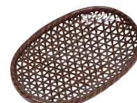
⑯ 塗小判オシボリ [QOSB-31]