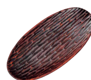
⑳ ノミ彫りおしぼり受け [QOSB-35] W

13-0871-1901 ¥2,500 サイズ:180×108×H20 材質:耐熱木質樹脂