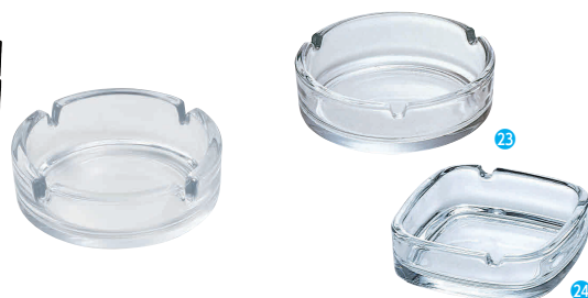
㉒ アンピラブルスタック 灰皿クリア [QHZR-26] E

サイズ 大 φ107×H35 13-0871-2101 ¥1,050 小 φ85×H36 13-0871-2102 ¥1,000 ●同じサイズの積重ねが可能。 ●ガラス製