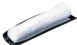
⑩ 柴舟おしぼり受 黒塗 [QOSB-09]

13-0871-1001 ¥500 サイズ:172×60×H17 材質:ABS樹脂