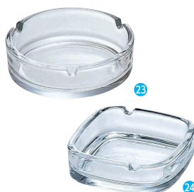
㉓ ガラス製 アルジェ灰皿 P-05513 [QHZR-17] E

サイズ 大 φ108×H35 13-0871-2201 ¥980 小 φ85×H36 13-0871-2202 ¥850 ●同じサイズの積重ねが可能。 ●ガラス製