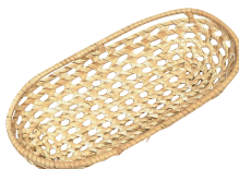
⑭ 籐小判オシボリ [QOSB-29]