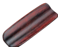
⑱ 富士おしぼり受け [QOSB-33] W

13-0871-1701 ¥1,350 サイズ:183×73×H10 材質:メラミン樹脂