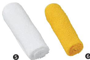
⑤ おしぼり No.80 白(1ダース入) [KHKN-28]

13-0871-0201 ¥1,200 サイズ:172×61×H20 材質:ソフトメラミン・フェノール木質 ●質感が木製に近くソフトな手触りです。