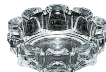
㉕ ガラス製 ローラー灰皿 P-05532 [QHZR-19] E