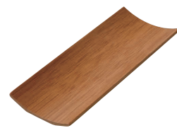
⑦ 竹製 スス角おしぼり入れ [QOSB-21]

13-0871-0501 ¥2,200 サイズ:400×270 材質:綿100%