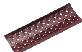
⑪ 竹目おしぼり受 溜 [QOSB-10]

13-0871-1001 ¥500 サイズ:172×60×H17 材質:ABS樹脂