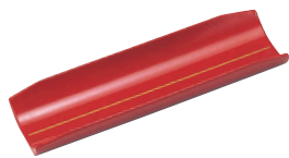
① 竹型おしぼり受 朱に金ライン [QOSB-12]

13-0871-0101 ¥1,400 サイズ:172×61×H20 材質:ソフトメラミン・フェノール木質 ●質感が木製に近くソフトな手触りです。