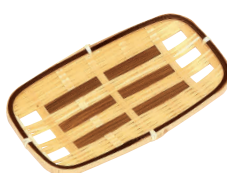
⑨ 竹製 おしぼり入れ スカシ オシボリW [QOSB-23]