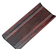
⑰ 千筋おしぼり受け [QOSB-32] W

13-0871-1701 ¥1,350 サイズ:183×73×H10 材質:メラミン樹脂