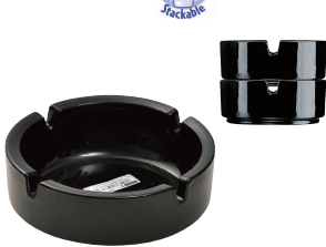
㉑ アンピラブルスタック 灰皿ブラック [QHZR-25] E

サイズ 大 φ107×H35 13-0871-2101 ¥1,050 小 φ85×H36 13-0871-2102 ¥1,000 ●同じサイズの積重ねが可能。 ●ガラス製