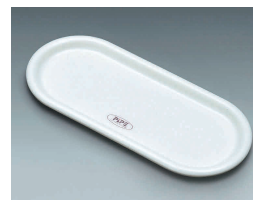
⑰ ピペ カスタートレー (L)