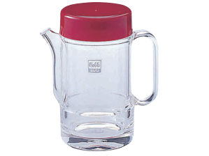
⑨ ノーブル しょう油サーバー レッド