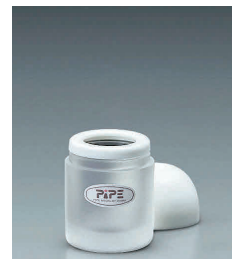
⑮ ピペ ヨウジ入れ