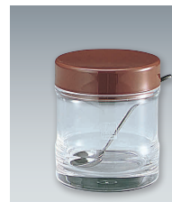
⑩ ノーブル シュガーポット