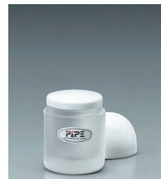
⑭ ピペ コショウ入れ(L)