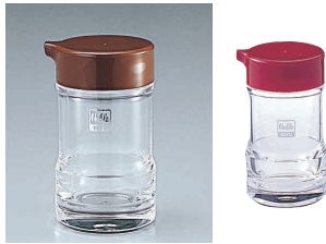
④ ノーブル しょう油さし