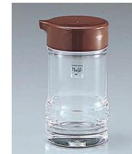
③ ノーブル ソースさし