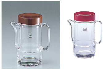
⑧ ノーブル とんかつソース入れ