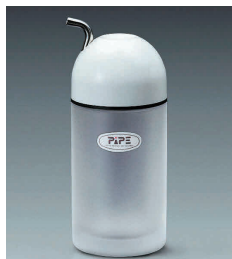
⑪ ピペ しょう油差し(LL)