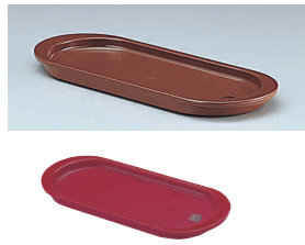
① ノーブル トレー (楕円)