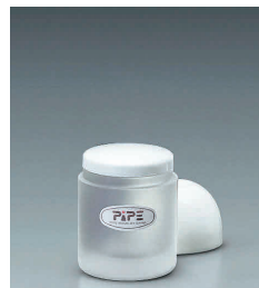
⑬ ピペ 塩入れ