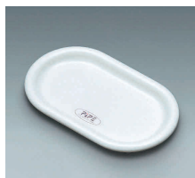
⑯ ピペ カスタートレー (S)