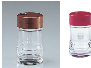
⑤ ノーブル 塩・胡椒入れ [QNOB-05] B