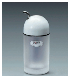
⑫ ピペ しょう油差し(L)