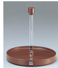
② ノーブル 回転カスター