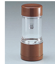
⑦ ノーブル ごますり器