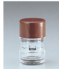
⑥ ノーブル 楊枝入れ [QNOB-06] B