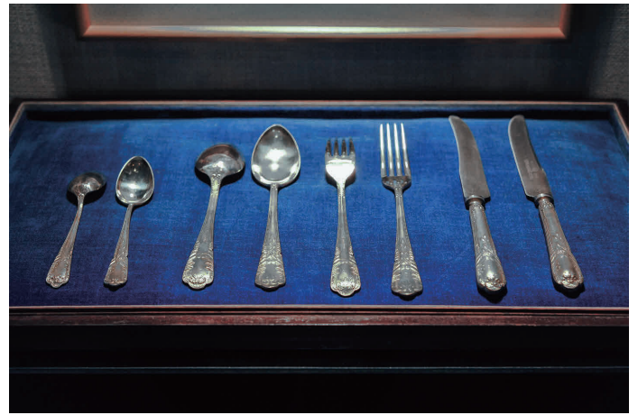
100年変わらないデザイン、日本最古カトラリー

東京銀座十一屋のカatalog254番。大正時代から続く日本最古のデザイン。函館や東京上野の洋食発祥のレストランで100年ご愛用いただいています。フランスロココ調の月桂樹デザインは、時代を超えて、爛し銀の輝きを放ちます。ナイフの刃に残る「編」と「目通し仕上げ」は、ヨーロッパの金属食器の伝統を伝えています。