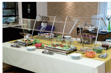
セッティングイメージ。