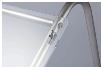
プラスドライバーを使用して組立できます。