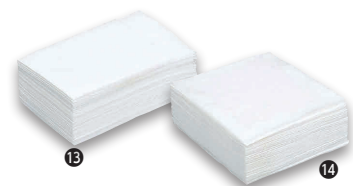
⑬ 紙 ナフキン 6ツ折 (10,000枚入) [MKNK-01] ㊦