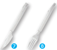
⑦ エクセレンス デザートナイフ クリア(100本入) [NSLA-41] G