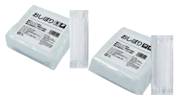
⑱ 不織布おしぼり テフキー-O3 (100枚入) [KHKN-35] ㊦

おしぼりサイズ S(48袋入) 120×215 13-0753-1801 ¥25,800 M(40袋入) 145×235 13-0753-1802 ¥25,800 L(36袋入) 180×235 13-0753-1803 ¥25,800 材質:不織布(レーヨン 40%, PET 60%) 成分:軟水 オゾン水(除菌・消臭) ●アルコール・塩素系不使用、人体に優しく除菌・消臭効果の高いオゾン水を使用し、高い清浄率(70%)のうえ低刺激です。 ●女性やお子様の手肌に優しい軟水で潤いを保持します。