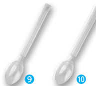
⑨ エクセレンス デザートスプーン クリア(100本入) [NSLA-43] △ G