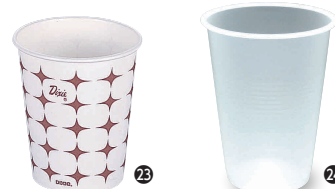
㉒ ホットカップ Rスパークル 7オンス(2,400入) [MKKP-01] ㊦