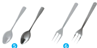
⑤ ミニスプーン(250本入) [NSLA-28] ◇ G