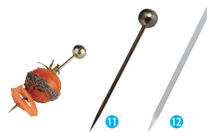
⑪ ピック シルバー(200本入) VO10204 [NSLA-31] △ G