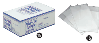
⑮ 紙 6ツ折ナフキン箱入 (10,000枚入) [MKNK-03] ㊦