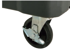
320S/550S サイレントキャスター