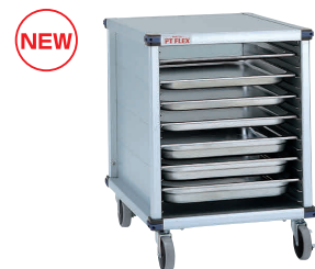
⑮ PTフレックスカート LOWタイプ PTWSEK オープンモデル (ガストロノームパン・ホテルパン対応)

[JPTF-23] 組 13-0646-1501 ¥165,000 サイズ: 636×777×H850 重量: 25.2kg 脚ピッチ: 37.5 有効棚板枚数: 15枚 耐荷重: 200kg 対応トレイサイズ: 650×525 ホテルパン: (1/1, 2/1) 対応 ※ガストロノームパンは別売りです