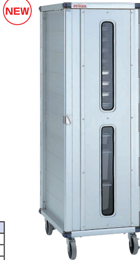
⑨ PTフレックスカート PTSTDEK ドア付モデル (シートパン・フードボックス)

■材質 本体: アルミニウム / 総アルマイト仕上げ キャスター: φ125×4輪自在(ウレタンゴム製) 対角2輪ストッパー付