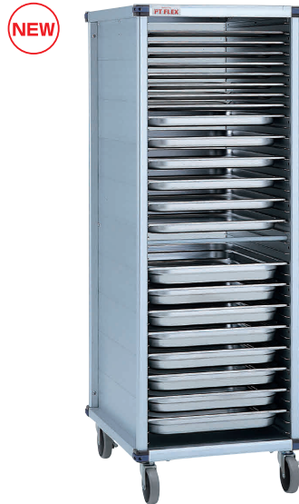
⑭ PTフレックスカート HIGHタイプ PTWTEK オープンモデル (ガストロノームパン・ホテルパン対応)

[JPTF-27] 組 13-0646-1301 ¥142,000 サイズ: 431×656×H850 重量: 21.2kg 脚ピッチ: 37.5 有効棚板枚数: 15枚 耐荷重: 200kg 対応トレイサイズ: 525×325 ホテルパン: (1/1, 1/2, 1/3) 対応 ※ガストロノームパンは別売りです