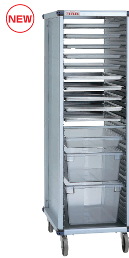
⑩ PTフレックスカート PTSTEK オープンモデル (シートパン・フードボックス)

[JPTF-28] 組 13-0646-0901 ¥319,000 サイズ: 561×792×H1733 重量: 47.9kg 脚ピッチ: 37.5 有効棚板枚数: 38枚 耐荷重: 200kg 対応トレイサイズ: 457×657 フードボックスサイズ: 457×660 (1/1, 1/2) 対応 ※シートパン、フードボックスは別売りです。