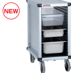
⑬ PTフレックスカート LOWタイプ PTGSEK オープンモデル (ガストロノームパン・ホテルパン対応)

[JPTF-26] 組 13-0646-1201 ¥194,000 サイズ: 431×656×H1,733 重量: 30.6kg 脚ピッチ: 37.5 有効棚板枚数: 38枚 耐荷重: 200kg 対応トレイサイズ: 525×325 ホテルパン: (1/1, 1/2, 1/3) 対応 ※ガストロノームパンは別売りです