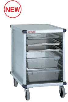
⑪ PTフレックスカートLOWタイプ PTSSEK ドア付モデル (シートパン・フードボックス)

[JPTF-24] 組 13-0646-1001 ¥204,000 サイズ: 561×792×H1733 重量: 35.2kg 脚ピッチ: 37.5 有効棚板枚数: 38枚 耐荷重: 200kg 対応トレイサイズ: 457×657 フードボックスサイズ: 457×660 (1/1, 1/2) 対応 ※シートパン、フードボックスは別売りです。