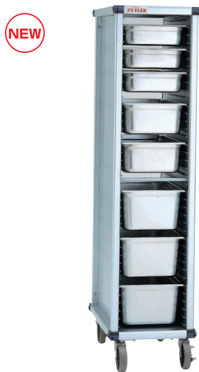
⑫ PTフレックスカート HIGHタイプ PTGTEK オープンモデル (ガストロノームパン・ホテルパン対応)

[JPTF-25] 組 13-0646-1101 ¥155,000 サイズ: 561×792×H850 重量: 24.6kg 脚ピッチ: 37.5 有効棚板枚数: 15枚 耐荷重: 200kg 対応トレイサイズ: 457×657 フードボックスサイズ: 457×660 (1/1, 1/2) 対応 ※シートパン、フードボックスは別売りです。