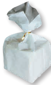
③ 食パン一斤用 ふわふわ紙袋 (100枚入) [MHKR-13] E

[MHKR-12] E サイズ 180 180×80×H175 13-0612-0201 ¥ 900 210 210×80×H175 13-0612-0202 ¥ 950 270 270×80×H175 13-0612-0203 ¥1,150 材質:紙、ポリプロピレン、OPP