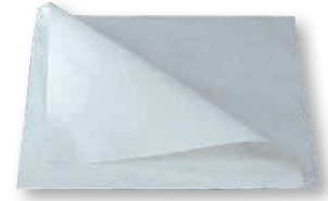
④ ほぼ油が染み出さない バーガー袋 (100枚入) [MHKR-14] E

13-0612-0301 ¥1,900 サイズ:125×120×H380 材質:紙、ポリエチレン