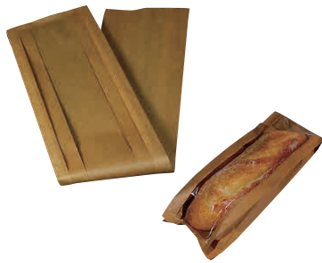
① 窓付フランスパン袋 (50枚入)

[MHKR-11] E 13-0612-0101 ¥1,500 サイズ:120×65×H600 材質:紙、ポリプロピレン、OPP