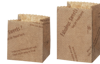
⑨ ポットベリー 麻袋ロゴ柄 (50枚入) [MRBG-08] OK

CP-32 クリーム 13-0612-0801 ¥248 CP-33 マーマレード 13-0612-0802 ¥248 サイズ:約250×250 材質:パーজনパルプ ●使いやすい約25cm角の4つ折タイプです。