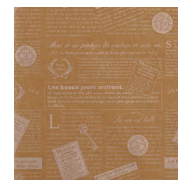
クラフトフレンチ