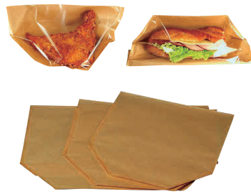
② 窓付デルタバッグ (100枚入)

[MHKR-11] E 13-0612-0101 ¥1,500 サイズ:120×65×H600 材質:紙、ポリプロピレン、OPP