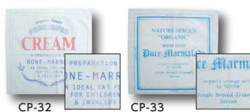
⑧ サンドイッチナップキン (50枚入) [MPNK-01] E

CP-32 クリーム 13-0612-0801 ¥248 CP-33 マーマレード 13-0612-0802 ¥248 サイズ:約250×250 材質:パーজনパルプ ●使いやすい約25cm角の4つ折タイプです。