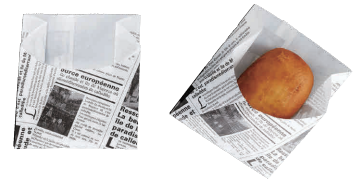
⑫ 耐油紙袋 ヨーロピアンハーフムーン No.210 (100枚入) [MRBG-09] OK

13-0612-1401 ¥1,780 サイズ:90×107 材質:耐油紙(晒) ●耐油紙で余分な油分を吸収します。 ●加熱された食品を入れても蒸気を通すため、水分によるベタ付きを抑えます。