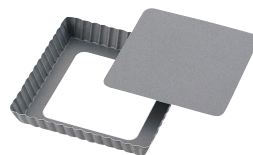
⑰ アルブリット セパタルト型 正方形 No.5175 [DTRT-23] 目