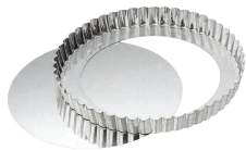
⑥ マトファ タルト 底取 [DTRT-03]