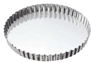
⑨ マトファ タルト 共底 [DTRT-02]