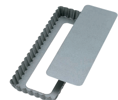
⑱ アルブリット セパタルト型 長方形 No.5252 [DTRT-17] 目