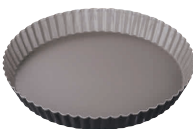
⑬ ブラック・フィギュア タルト型 共底 [DTRT-31] 目