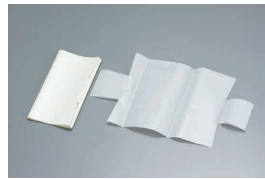
② ステンパウンド用 敷紙(30枚入)