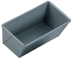
⑩ アルブリット ニューパウンド型