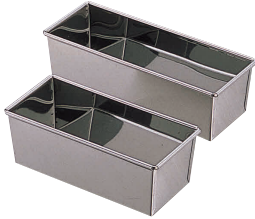
① ステン パウンド型