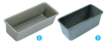
⑧ TSスリムパウンド型 中 DL-6155 [DPND-16] E