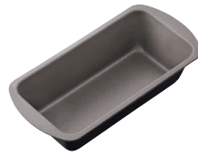
⑥ ブラック・フィギュア パウンドケーキ型(深) [DPND-26] E