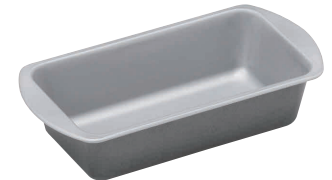
⑬ パウンドケーキ型 SV [DPND-03] E