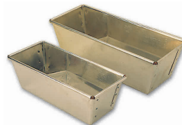
⑯ マトファ パウンド型 [DPND-01] E