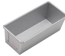
③ アルスター ニューパウンド 細型 [DPND-13] ◇ E