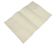
④ アルスター ニューパウンド細型用 敷紙(30枚入) [DPND-15] ◇ E