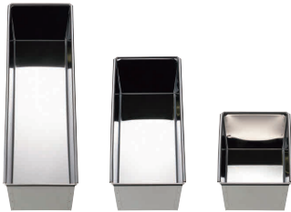
⑤ 18-0 パウンド型 [DPND-23] E