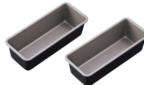
⑦ ブラック・フィギュア パウンドケーキ型(細) [DPND-25] E