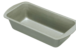
⑫ フッ素樹脂 ベイクウェア パウンドケーキ型(ラウンド) [DPND-10] E