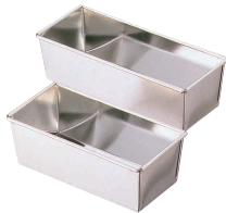
⑭ ブリキ パウンド型 [DPND-06]