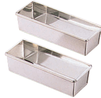
⑮ ブリキ ミニパウンド型 [DPND-07]