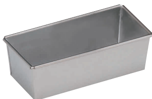
⑱ パウンドケーキ型 ミラー PP-606 [DPND-04] E