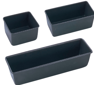
⑪ WJ テフロン パウンド型 [DPND-19]