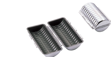
⑰ プロアスター 合セットヨ [DTYO-07]