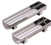
⑬ 18-0 ステン足付トヨ 丸型 [DTYO-02]