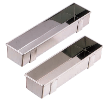
⑭ 18-0 ステン足付トヨ 角型 [DTYO-04]