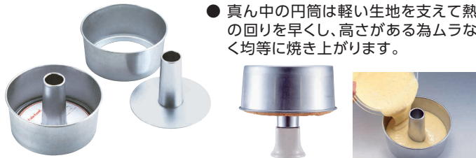
⑤ アルスター 安全シフォンケーキ型底取 [DCFN-08] E