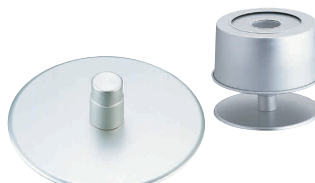
⑩ アルミ シフォンケーキ型 クールスタンド [DCFN-13]