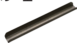
⑲ 川口板金製 セイボリー型 [DTYO-09]