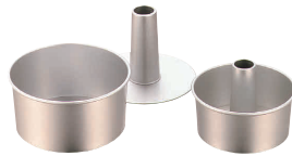
② アルミ シフォンケーキ型