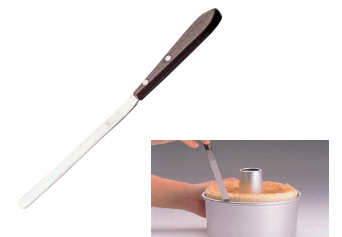
⑪ シフォンナイフ [DCFN-04] E