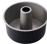
⑥ ブラック・フィギュア シフォンケーキ焼型 底取 [DCFN-21] E

●真ん中の円筒は軽い生地を支えて熱の回りを早くし、高さがある為ムラなく均等に焼き上がります。