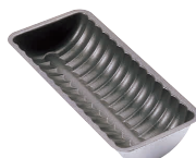
⑱ プロアスター パウンドトヨ型 [DTYO-08]