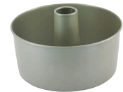
⑦ フッ素樹脂 バイクウェア シフォンケーキ型(底取) [DCFN-22] E