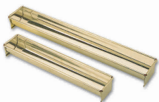
⑫ マトファ ブッシュ・ド・ノエル [DTYO-01]