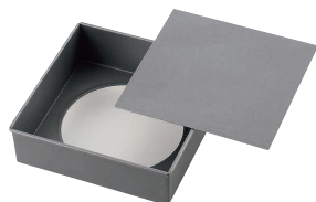
10 アルブリット セパト角デコ型 底取 [DDCO-33] E

内寸 品番 価格 18cm 180×180×H60 13-0571-0901 ¥1,890 21cm 210×210×H60 13-0571-0902 ¥2,090 24cm 240×240×H60 13-0571-0903 ¥2,270 材質: アルミメッキ鋼板