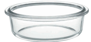
4 iwaki スポンジ型 KBC240 [DDCO-43] E

内寸 品番 価格 15cm φ150×H40 13-0571-0301 ¥1,300 18cm φ180×H42 13-0571-0302 ¥1,480 21cm φ210×H45 13-0571-0303 ¥1,640