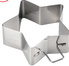
19 18-0 パンケーキリング 深型 星 No.1697

[DSL-18] E 13-0571-1901 ¥850 サイズ: 102×98×H40 ●分厚いパンケーキや目玉焼きがきれいに丸く作れます。