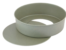
2 フッ素樹脂 ベイクウェア チーズケーキデコ底取型 [DDCO-21] E

内寸 品番 価格 15cm φ150×H60 13-0571-0101 ¥1,100 18cm φ180×H70 13-0571-0102 ¥1,300 21cm φ210×H80 13-0571-0103 ¥1,600 材質: スチール・フッ素樹脂加工