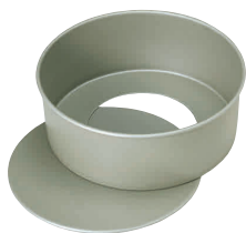
1 フッ素樹脂 ベイクウェア デコレーションケーキ底取型 [DDCO-20] E

[DSL-20] E 13-0571-2101 ¥850 サイズ: 90×93×H40 ●分厚いパンケーキや目玉焼きがきれいに丸く作れます。