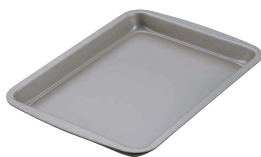
13 ロールケーキ型 DL-6132 [DDCO-26] E

13-0571-1301 ¥1,600 外寸: 300×220×H25 材質: 鉄(フッ素樹脂塗膜加工)