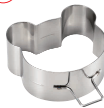
20 18-0 パンケーキリング 深型 グマ No.1698

[DSL-19] E 13-0571-2001 ¥850 サイズ: 89×78×H40 ●分厚いパンケーキや目玉焼きがきれいに丸く作れます。