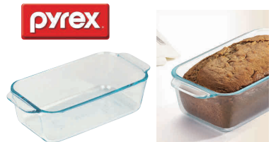
16 パイレックス パウンド・ローフディッシュ 1.4L [APYR-06] E

13-0571-1601 ¥1,500 サイズ: 255×125×H70 内寸: 210×110×H60 材質: 強化ガラス ●オープンで使えるので、パンやケーキ作りに大活躍。 ●オープン・冷凍庫対応 ※急加熱、急冷不可