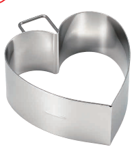
18 18-0 パンケーキリング 深型 ハート No.1696

[DSL-17] E 13-0571-1801 ¥850 サイズ: φ85×88×H40 ●分厚いパンケーキや目玉焼きがきれいに丸く作れます。