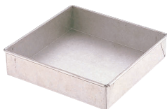
9 アルタイト 角デコ缶 [DDCO-16]

13-0571-0401 ¥1,200 内寸: φ180×H60 材質: 耐熱ガラス ●電子レンジ・オープン・食洗器対応