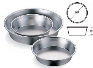
3 18-8 総絞り テーパーケーキ型 (共底) [DDCO-05]

内寸 品番 価格 18cm φ180×H58 13-0571-0201 ¥1,100 21cm φ210×H58 13-0571-0202 ¥1,400 材質: スチール・フッ素樹脂加工