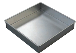
12 アルスター マルシェ焼型角 [DDCO-41] E

内寸 品番 価格 No.5261 16cm 160×160×H36 13-0571-1101 ¥1,800 No.5262 18cm 180×180×H36 13-0571-1102 ¥1,900 No.5249 20cm 200×200×H34 13-0571-1103 ¥2,100 No.5250 22cm 220×220×H34 13-0571-1104 ¥2,400 材質: アルミニウム(フッ素樹脂2コート)