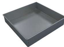
11 アルブリット マルシェ焼型 [DDCO-40] E

内寸 品番 価格 No.5263 15cm 150×150×H60 13-0571-1001 ¥2,900 No.5264 18cm 180×180×H60 13-0571-1002 ¥3,200 材質: アルミニウム(フッ素樹脂2コート) ●2コートの為、型抜けが良く、こびりつきにくい。