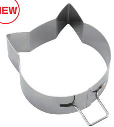
21 18-0 パンケーキリング 深型 ネコ No.1699

[DSL-20] E 13-0571-2101 ¥850 サイズ: 90×93×H40 ●分厚いパンケーキや目玉焼きがきれいに丸く作れます。