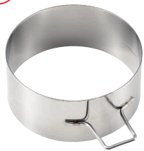
17 18-0 パンケーキリング 深型 丸 No.1695

[DRNG-02] E 13-0571-1701 ¥850 サイズ: φ89×H40 ●分厚いパンケーキや目玉焼きがきれいに丸く作れます。