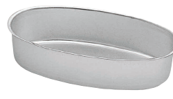
15 アルマイト オーバルカップ SN6861 [DDCO-35] E

外寸 品番 価格 No.2386 25cm 247×247×H18 13-0571-1401 ¥1,350 No.2349 27cm 269×269×H17 13-0571-1402 ¥1,450 材質: スチール(アルミメッキ) ●くるくる巻く時に丁度良い高さになっているので、出来上がりがキレイに仕上がります。