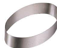
⑥ 18-8 アルゴン オーバルリング