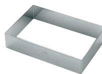
⑬ 18-8 アルゴン長角セルクル [DSLCL-13]