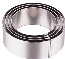
⑤ 18-8 ジャンボかみ合せ 丸セルクル (イングリッシュマフィン) [DSLCL-05]