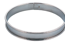
⑪ 18-8 測巻タルトリング [DTRR-04]