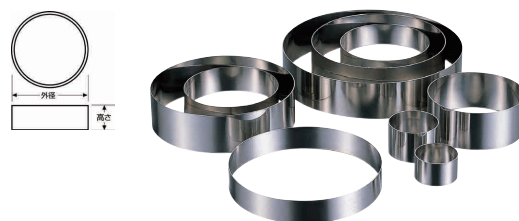
② 18-8 アルゴン溶接 ケーキリング [DSLCL-01] ◇