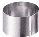
④ 18-8 かみ合せ 丸セルクル