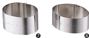
⑦ 18-8 かみ合せ 小判セルクル [DSLCL-06]