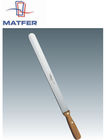
⑮ マトファ INOXナイフ ノコ刃 [CRBF-01] ◇