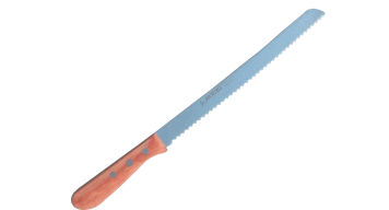
⑱ ステンレス パン切包丁 茶合板柄 [CHRA-05] ◇ E

250mm 13-0556-1801 ¥4,300 全長:370 材質:刃材/ステンレス刃物鋼 柄材:茶合板材