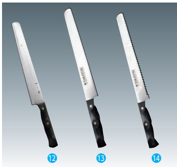
⑫ 堺孝行 打刃 カステラナイフ [CHDE-01] ◇ E

200mm 13-0556-1101 ¥550 全長:320 刃材質:ステンレス刃物鋼