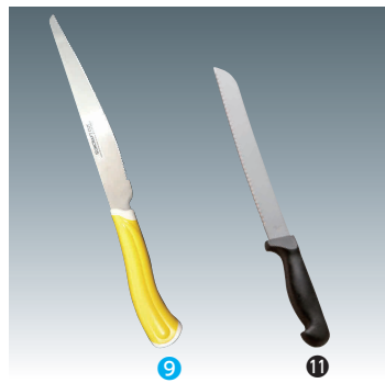
⑨ スムーズパン切りナイフ HE-2101 [CHOA-01] ◇ E

230mm 13-0556-0901 ¥2,200 全長:370 刃材質:ステンレス刃物鋼