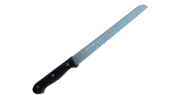
⑲ モリブデン鋼 パン切包丁 黒合板柄 [CHRA-04] ◇ E

250mm 13-0556-1801 ¥4,300 全長:370 材質:刃材/ステンレス刃物鋼 柄材:茶合板材