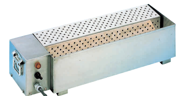
⑳ 電気式 ナイフウォーマーN450型 [CNWM-01] E

250mm 13-0556-1901 ¥6,400 全長:380mm 材質:刃材/モリブデン鋼 柄材:黒合板材