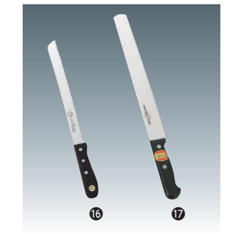
⑯ 堺菊守 ステンレス パン切 [CHAT-05] ◇