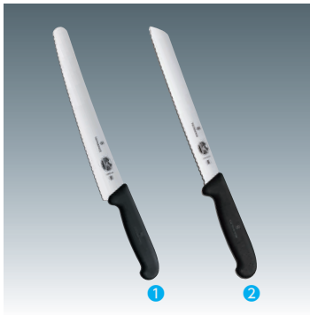
① ブレッドナイフ ブラック [CVNX-16] ◇ G 洗 +

210mm 13-0556-0101 ¥5,000 全長:342 材質:ステンレス