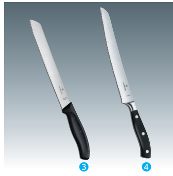
③ ブレッドナイフPro ブラック [CVNX-28] ◇ G 洗 +

210mm 13-0556-0201 ¥5,500 全長:350 材質:ステンレス