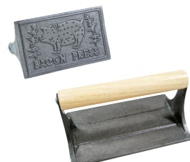
⑥ ベーコンプレス 肉押さえ 角小 A-147 [HNOS-05] 目