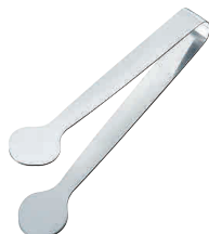
⑰ T=One 18-0 フラット薬味トング [BTGD-42] 目