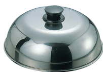
① 18-0 PC柄 お好み焼きカバー