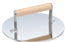
⑨ 18-0 丸型 肉オサエ [HNOS-07]