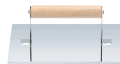
⑧ 18-0 角型 肉オサエ [HNOS-06]