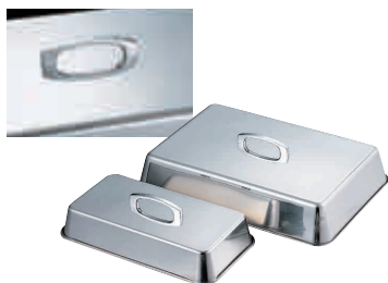
② 18-8 角型ステーキカバー [HSTK-03]