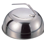
③ 18-8 共柄 丸カバー [HSTK-04]