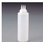
⑩ 3ツ穴 ディスペンサー [BDPS-07] 目