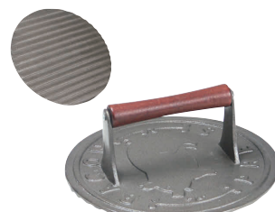
⑦ ベーコンプレス 肉押さえ 丸 A-146 [HNOS-03] 目