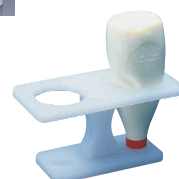
⑫ PC マヨネーズ立て [BDPS-17] 目

材質:本体/ポリエチレン キャップ/ポリプロピレン ●先端に5つの穴が開いており、マヨネーズ等を格子模様にレイアウトできます。 ●蓋が付いているので、衛生的です。