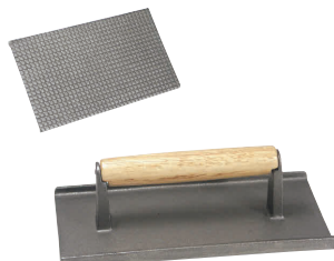
⑤ ベーコンプレス 肉押さえ 角大 A-148 [HNOS-04] 目