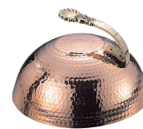
④ 銅製 ステーキカバー 丸型 [HSTK-05] 目