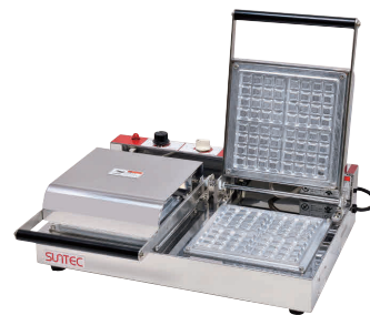
④ ワッフルメーカー SB-20(2連式) [HWFL-04] P 受 値

13-0508-0301 ¥138,000 サイズ:255×445×H165 蓋開時:H440 電源:単相100V 50/60Hz 750W 焼き上がり:177×177×H16 温度調節:サーモスタート 30°C~200°C ●特注にて200V(単相のみ)仕様可能