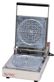
① ワッフルメーカー ST-1(1連式) [HWFL-01] P 値

13-0508-0101 ¥138,000 サイズ:255×445×H165 蓋開時:H440 電源:単相100V 50/60Hz 750W 焼き上がり:φ174×H16 温度調節:サーモスタート 30°C~200°C ●特注にて200V(単相のみ)仕様可能