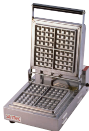
⑦ ベルジャン ワッフルメーカー SBW-100(4/4) (1連式) [HWFL-07] P 値

13-0508-0601 ¥238,000 サイズ:510×445×H180 蓋開時:H460 電源:単相100V 50/60Hz 1,500W 焼き上がり:98×150×H26(2個) 温度調節:サーモスタート 30°C~200°C ●特注にて200V(単相・3相)仕様可能