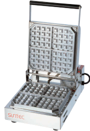
⑪ ベルジャン ワッフルメーカー SBW-100-4 (1連式) [HWFL-11] P 受 値

13-0508-1001 ¥238,000 サイズ:510×445×H180 蓋開時:H460 電源:単相100V 50/60Hz 1,500W 焼き上がり:87×87×H26(8個) 温度調節:サーモスタート 70°C~200°C ●特注にて200V(単相・3相)仕様可能