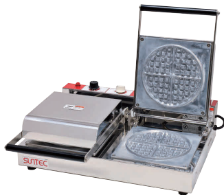
② ワッフルメーカー ST-2(2連式) [HWFL-02] P 値

13-0508-0101 ¥138,000 サイズ:255×445×H165 蓋開時:H440 電源:単相100V 50/60Hz 750W 焼き上がり:φ174×H16 温度調節:サーモスタート 30°C~200°C ●特注にて200V(単相のみ)仕様可能