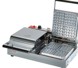
⑫ ベルジャン ワッフルメーカー SBW-200-4 (2連式) [HWFL-12] P 受 値

13-0508-1101 ¥138,000 サイズ:255×445×H180 蓋開時:H460 電源:単相100V 50/60Hz 750W 焼き上がり:98×98×H26(4個) 温度調節:サーモスタート 70°C~200°C ●特注にて200V(単相のみ)仕様可能