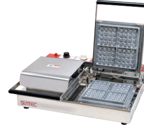
⑧ ベルジャン ワッフルメーカー SBW-200(4/4) (2連式) [HWFL-08] P 値

13-0508-0701 ¥138,000 サイズ:255×445×H180 蓋開時:H460 電源:単相100V 50/60Hz 750W 焼き上がり:87×87×H26(4個) 温度調節:サーモスタート 70°C~200°C ●特注にて200V(単相のみ)仕様可能