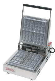
⑨ ベルジャン ワッフルメーカー SBW-100(3/4) (1連式) [HWFL-09] P 受 値

13-0508-0801 ¥238,000 サイズ:510×445×H180 蓋開時:H460 電源:単相100V 50/60Hz 1,500W 焼き上がり:87×87×H26(8個) 温度調節:サーモスタート 70°C~200°C ●特注にて200V(単相・3相)仕様可能