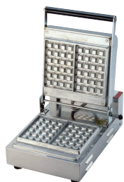
⑤ ベルジャン ワッフルメーカー SBW-100 角型 (1連式) [HWFL-05] P 受 値

大きさ、形状、食感まで思いのまま! アイデア次第で手軽に広がるワッフルメニュー!!