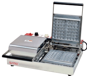
⑥ ベルジャン ワッフルメーカー SBW-200 角型 (2連式) [HWFL-06] P 受 値

13-0508-0501 ¥138,000 サイズ:255×445×H180 蓋開時:H460 電源:単相100V 50/60Hz 750W 焼き上がり:98×150×H26 温度調節:サーモスタート 30°C~200°C ●特注にて200V(単相のみ)仕様可能