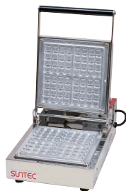
③ ワッフルメーカー SB-10(1連式) [HWFL-03] P 受 値

13-0508-0201 ¥238,000 サイズ:510×445×H165 蓋開時:H440 電源:単相100V 50/60Hz 1,500W 焼き上がり:φ174×H16(2個) 温度調節:サーモスタート 30°C~200°C ●特注にて200V(単相・3相)仕様可能