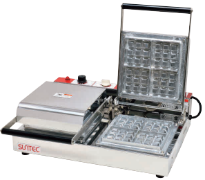
⑩ ベルジャン ワッフルメーカー SBW-200(3/4) (2連式) [HWFL-10] P 受 値

13-0508-0901 ¥138,000 サイズ:255×445×H180 蓋開時:H460 電源:単相100V 50/60Hz 750W 焼き上がり:87×87×H26(4個) 温度調節:サーモスタート 70°C~200°C ●特注にて200V(単相のみ)仕様可能