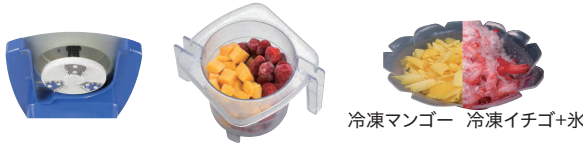
冷凍マンゴー 冷凍イチゴ+氷