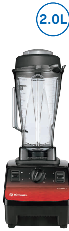
(仕込・ドリンク用)

「ツインベアリング」を採用 … ブレードシャフトの回転がスムーズで、抜群の耐久性を誇ります。 Vitamix 独自のブレード加工 … レーザーカットによる1枚物のブレードにテフロンシールを施し、耐久性に優れます。 簡単に分解洗浄ができ衛生的 … 専用工具「リテーナー」でブレードアセンブリを取り外し、すみずみまで清掃可能です。