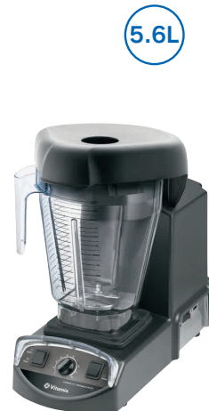
(仕込・ドリンク用)