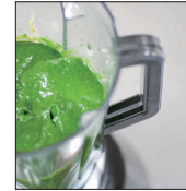
なめらかな仕上が