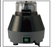
主電源スイッチ付き