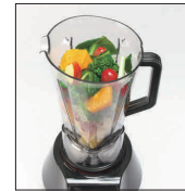
ほうれん草ピーナツ ツ和え+ゲル化剤

13-0480-0201 ¥150,000 サイズ:230×270×H515 重量:6kg 容器容量:2.0ℓ 処理容量:0.3~1.5ℓ 電源:100V 50/60Hz 消費電力:770W 回転数:3,000~24,000回/分 定格時間:15分(4分運転・2分休止) 電源コード:2.15m ●80℃までの温かい食材にも対応。