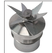
6枚刃が切削性能を高 める。高い切削性能