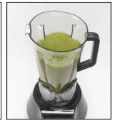
グリーンスムージー