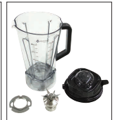
分解・清掃で衛生的