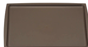
③ 長角盆 ブラウン ノンスリップ [FNST-27]