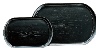
⑮ 木製ブラックトレー (ウレタン塗装) [FKBN-06]