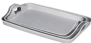
⑧ アルミ脇取盆 (エンボス加工) [FWTB-01]