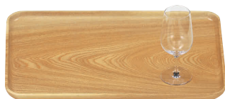
⑬ 白木 サービストレー (ウレタン塗装) [FKBN-03]