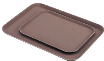
① キャンプロ 角型ノンスリップトレー [FNST-03]