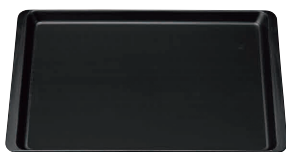
⑬ 長角盆 黒 ノンスリップ [FKBN-21]