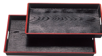
⑥ 木目脇取盆 黒天朱 [FWTB-02]