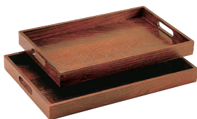
⑦ 椀取盆 [FKBN-19]