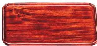
⑪ 木製 角皿 (ウレタン塗装) [FKBN-01]