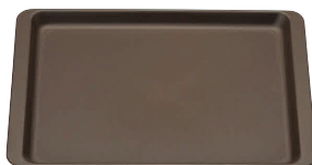
② 長角盆 ブラウン ノンスリップ [FNST-28]