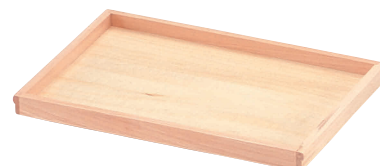
⑨ 木製 長角盆 (ウレタン塗装) [FKBN-20]