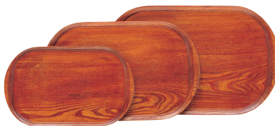
⑭ 木製トレー (ウレタン塗装) [FKBN-05]