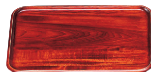
⑫ 木製 長角盆 (ウレタン塗装) [FKBN-02]