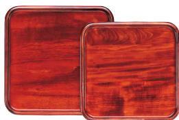
⑩ 木製 正角盆 (ウレタン塗装) [FKBN-04]