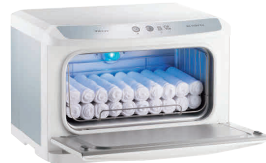
② タイジ ホットキャビ HC-11UV Pro (殺菌灯付・前開き) [FTWM-47]

13-0435-0101 ¥50,000 (おしぼり=約50本) 電源:単相100V 50/60Hz 消費電力:120W 温度調節:電子制御 庫内温度:70°C、80°C(2段切換) 外形寸法:350×275×H290 庫内寸法:274×195×H185 庫内容量:10ℓ 重量:6kg 付属品:棚皿×1 ドレイン受け×1