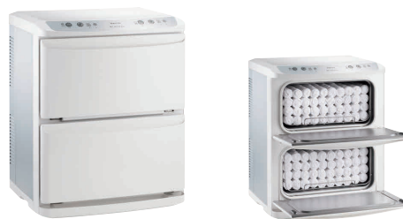
⑤ タイジ ホットキャビ HC-21LX Pro(前開き)

[FTWM-50] 13-0435-0401 ¥120,000 (おしぼり=約55本) 電源:単相100V 50/60Hz 消費電力:150W 温度調節:マイコン制御 庫内温度:HOT/70~80°C(標準温度) COOL/7~10°C(周辺温度25°Cの場合) 外形寸法:450×363×H322 庫内寸法:348×207×H152 庫内容量:11ℓ 重量:10kg 付属品:棚皿×1 ドレイン受け×1 変換プラグ×1