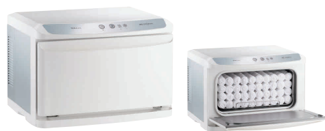
④ タイジ ホットキャビ HC-11LX Pro(前開き)

[FTWM-50] 13-0435-0401 ¥120,000 (おしぼり=約55本) 電源:単相100V 50/60Hz 消費電力:150W 温度調節:マイコン制御 庫内温度:HOT/70~80°C(標準温度) COOL/7~10°C(周辺温度25°Cの場合) 外形寸法:450×363×H322 庫内寸法:348×207×H152 庫内容量:11ℓ 重量:10kg 付属品:棚皿×1 ドレイン受け×1 変換プラグ×1