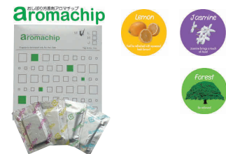
⑥ タオル蒸し器用 芳香剤アロマチップ (30個入) [FTWM-29]

[FTWM-51] 13-0435-0501 ¥200,000 (おしぼり=約110本) 電源:単相100V 50/60Hz 消費電力:300W 温度調節:マイコン制御 庫内温度:HOT/70~80°C(標準温度) COOL/7~10°C(周辺温度25°Cの場合) 外形寸法:450×363×H562 庫内寸法:348×207×H152×2段 庫内容量:11ℓ×2 重量:17kg 付属品:棚皿×2 ドレイン受け×1 変換プラグ×1