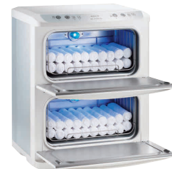
③ タイジ ホットキャビ HC-21UV Pro (殺菌灯付・前開き) [FTWM-48]

13-0435-0201 ¥75,000 (おしぼり=約55本) 電源:単相100V 50/60Hz 消費電力:190W 温度調節:マイコン制御 庫内温度:70~80°C(標準温度) 外形寸法:450×363×H322 庫内寸法:348×207×H152 庫内容量:11ℓ 重量:7.5kg 付属品:棚皿×1 ドレイン受け×1 変換プラグ×1