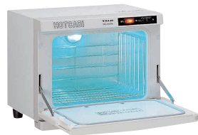
① タイジ ホットキャビ HC-10UVe (殺菌灯付・前開き) [FTWM-20]

13-0435-0101 ¥50,000 (おしぼり=約50本) 電源:単相100V 50/60Hz 消費電力:120W 温度調節:電子制御 庫内温度:70°C、80°C(2段切換) 外形寸法:350×275×H290 庫内寸法:274×195×H185 庫内容量:10ℓ 重量:6kg 付属品:棚皿×1 ドレイン受け×1