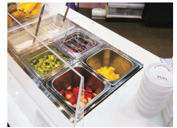
HOT & COOL (HS-1+PS-1)

13-0418-0101 ¥200,000 サイズ:262×320×H490 重量:8kg 電源:単相100V 50/60Hz 消費電力:620W 温度調節:可変式サーモスタット 温度範囲:30~90℃ 容量:5ℓ 付属品:変換プラグ、食品機械用グリース ※コーンやクルトンなどの固形物は製品内には入れず、カップに注いでから追加してください。