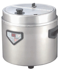
湯煎式蒸気熱の仕組み