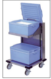
※コンテナは別売です。