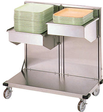
KN 4245 W