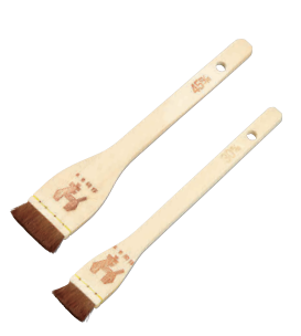
④ 木曽駒印 タレハケ (馬・胴毛・茶色)