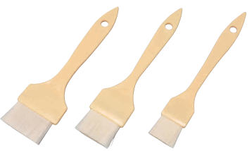
⑧ プラ柄 ナイロンハケ