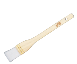
⑥ 木曽駒印 厚口 アクリルハケ