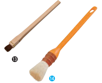
⑬ 竹柄 寿司はけ (馬毛)