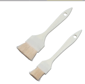
⑨ プラ柄 白ハケ (山羊)