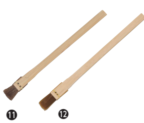
⑪ 竹柄 小物ハケ (馬毛)