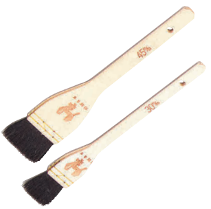
③ 木曽駒印 黒ハケ (山羊・尾)