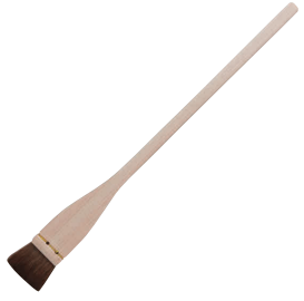
⑩ 江戸前ハケ (馬毛)