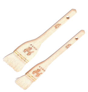
② 木曽駒印 白ハケ (山羊)