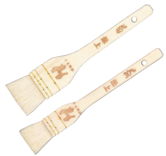
① 木曽駒印 最上白ハケ (山羊)