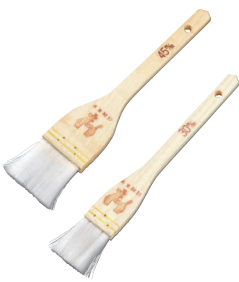
⑦ 木曽駒印 ナイロンハケ