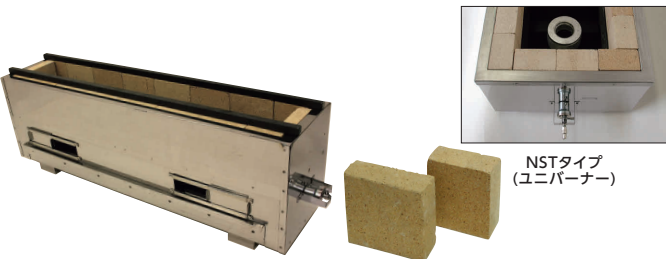
NSTタイプ (ユニバーナー)