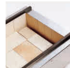
耐火レンガ 木炭コンロ 内部